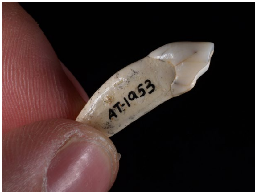
Diente de la Sima de los Huesos.

riguar si ha habido cambios en la dieta”, añade.