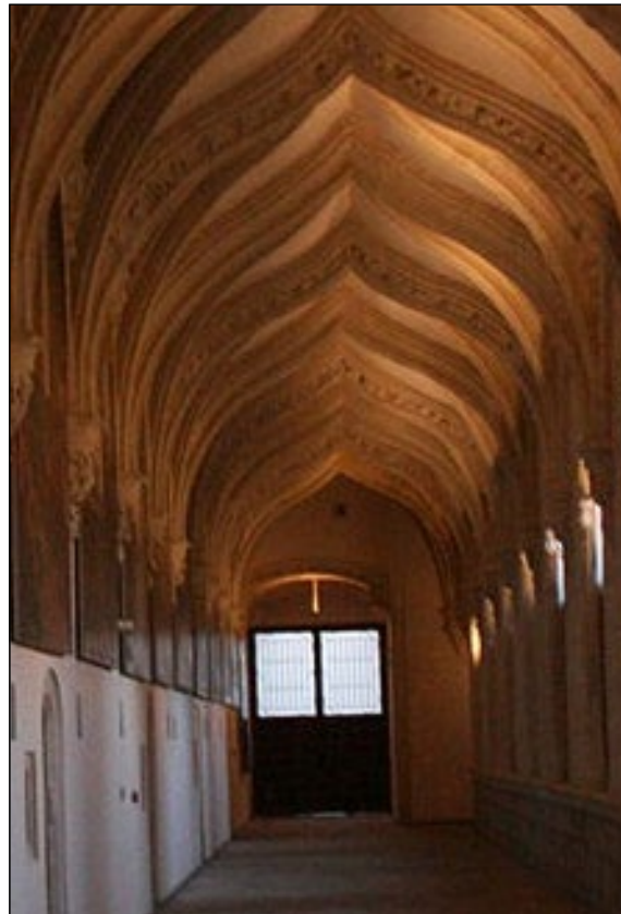
Claustro con las obras de Vicente Carducho.

El método, que se publica en la revista Renewable Energy , ha sido probado en el claustro del Monasterio de Santa María de El Paular (Madrid), donde se exponen 54 cuadros de Vicente Carducho . El cálculo ideado por los científicos tiene en cuenta la posición del Sol, cada tipo de día desde el punto de vista meteorológico y cómo se comporta esta radiación en el claustro, en concreto, en las zonas donde están colocadas las pinturas.