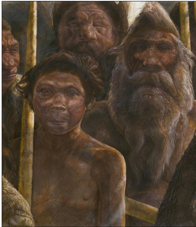
Ilustración de una familia de Homo heidelbergensis . Autor: Kennis & Kennis / Madrid Scientific Films.

“Las moléculas que ingerimos cuando comemos se incorporan a todos los tejidos de nuestro cuerpo, incluyendo el pelo, la piel, los dientes y los huesos”, detalla García García . “Dado que los dientes crecen a lo largo del tiempo, podemos analizar las moléculas para ave-