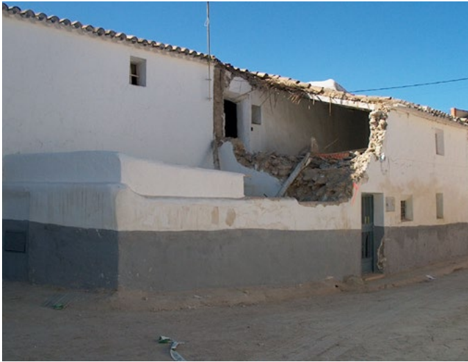
Daños en una casa de Zarcilla de Ramos por el terremoto de Bullas en 2005 (Mw=5.0)

lo y un monográfico editado por los investigadores de la Universidad Complutense .