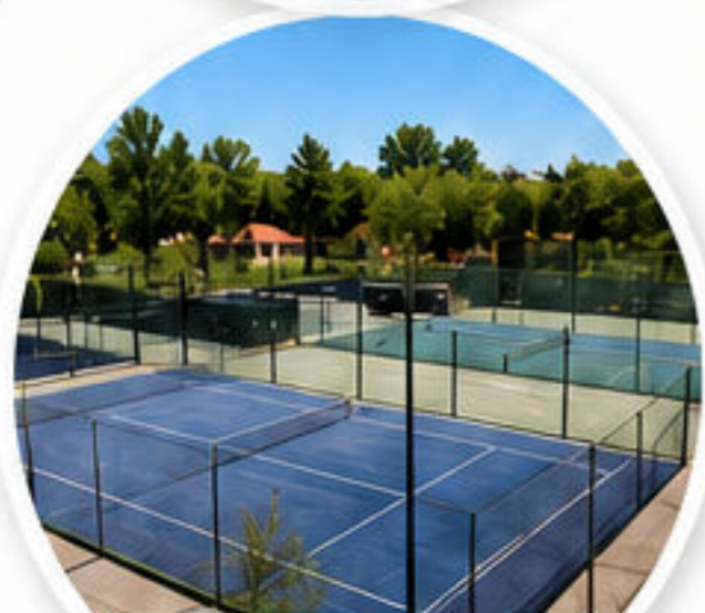
TENIS Y PÁDEL