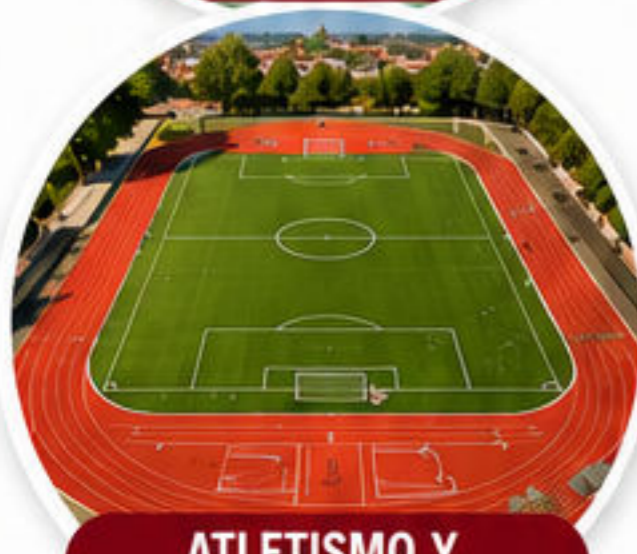
ATLETISMO Y DEPORTES DE CAMPO