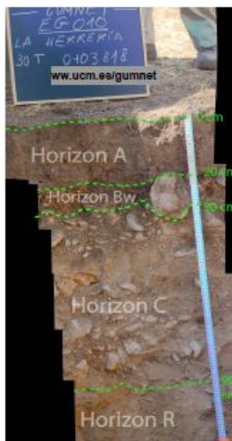
Trinchera. Perfil de suelo excavado en EG010-Herrería.

Además de la atmósfera, en EG010-Herrería también se monitoriza la evolución de la temperatura y la humedad del subsuelo a partir de 2 boreholes, de 2 y 20m respectivamente, y de una trinchera con sensores situados a 4, 20, 50 y 100 cm de profundidad.