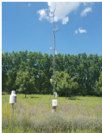
Estación GuMNet EG010-Herrería (920 ms.n.m.)

Se realizarán, también, charlas en el campamento de Santa María del Buen Aire, dentro del Bosque de La Herrería, donde conoceremos más en profundidad la red GuMNet y otros estudios que han hecho uso de sus datos, tales como la variabilidad de la temperatura y la precipitación en la zona, la difusividad térmica del suelo, flujos turbulentos y brisas de montaña.