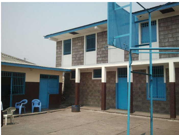
Foyer Père Gérard, centro abierto para las niñas/jóvenes de menos de 18 años

Estos centros están abiertos las 24 horas del día, y a ellos pueden acudir los niños y niñas que viven en la calle para comer, ducharse o para dormir. También disponen de clases de alfabetización. En ellos trabajan varios educadores. La misión de estos centros es dar asistencia a los niños de la calle así como servir de medio intermedio desde el que animarles a que se integren en los programas de reinserción a través de los “centros cerrados”. Hay que tener en cuenta que una asociación como ORPER tan sólo puede acoger en sus centros cerrados y programas de reinserción familiar a aquellos niños y niñas que voluntariamente se quieran adherir a los mismos.