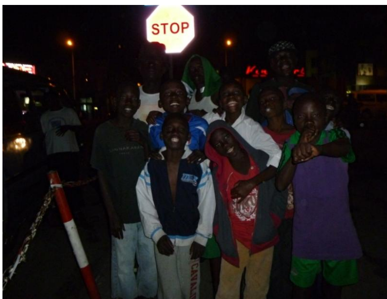
Grupo de niños de la calle en el centro de Kinshasa, en el momento de ser visitados por el “centre mobile” de ORPER, durante la noche.

Finalmente, merece la pena destacar que existe un porcentaje relativamente alto de niños de la calle con discapacidades, y que algunos niños de la calle acaban convirtiéndose en adultos de la calle, normalmente mendigos con problemas de alcoholismo.