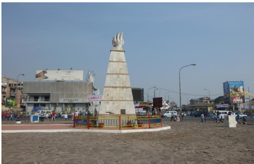
Kinshasa, Place de la Victoire.

En definitiva, y volviendo a la idea de la “ambivalencia”, la situación de Kinshasa, y del Congo en general, es la de una sociedad con unos niveles de pobreza extremos, consecuencia de una historia y una evolución institucional bastante desafortunadas; pero, y aunque resulte tópico decirlo, también se trata de una sociedad con gran potencial humano, cultural y de recursos naturales que, en la medida en que se avance en el proceso de estabilización social e institucional actual, puede que acabe siguiendo la senda de despegue económico y social que ya han iniciado otros países africanos como Kenia, Tanzania, Senegal, Namibia, etc.