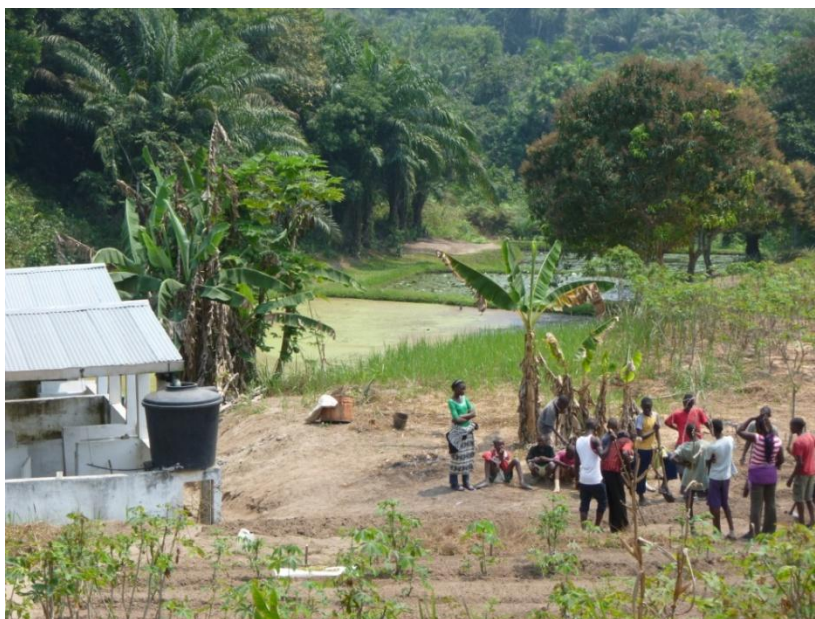
Granja con niños y niñas en el período de “colonie de vacances”.