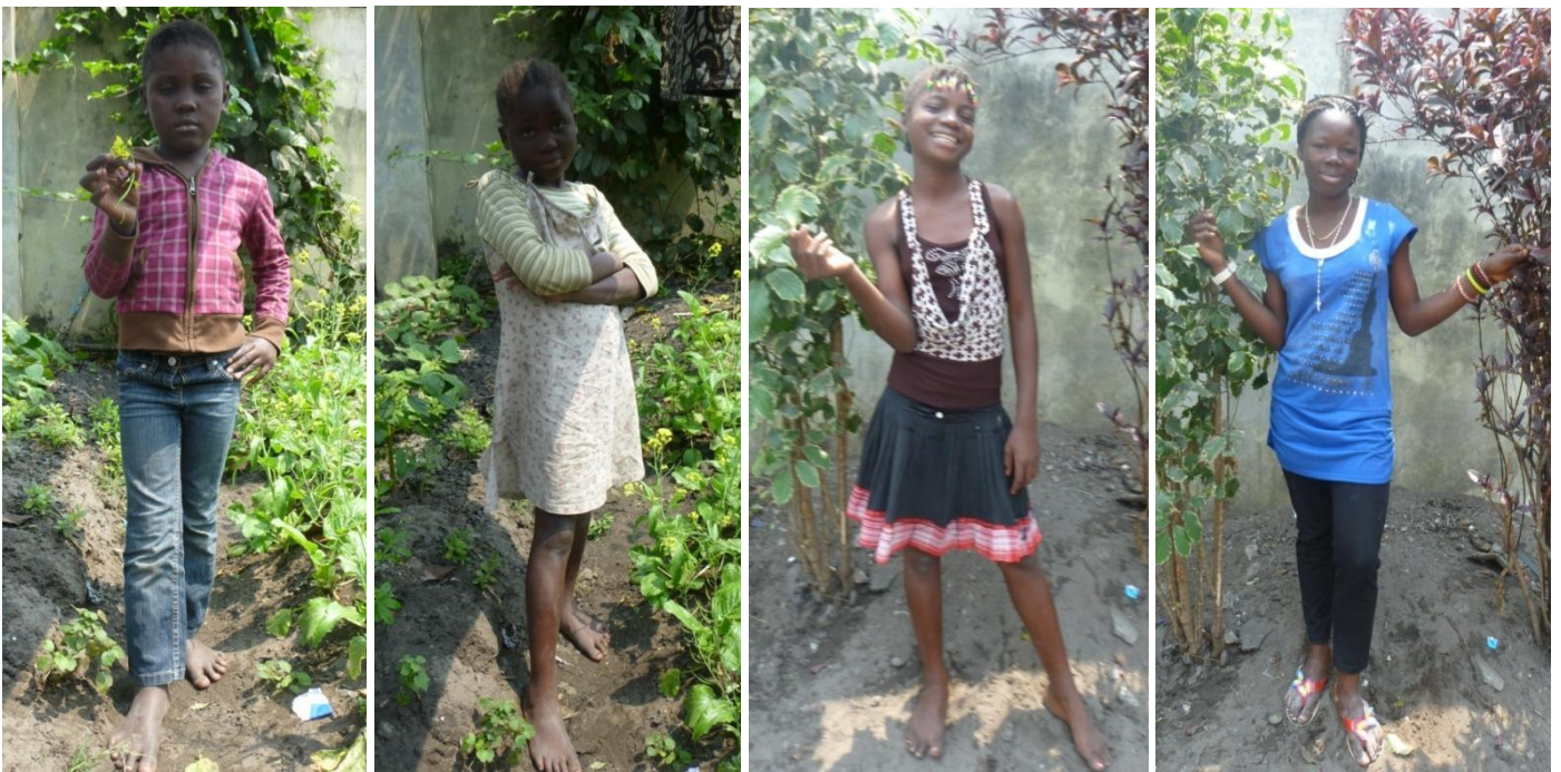
Niñas residentes en “Home Maman Suzanne” (centro cerrado). 13/8/2013

Por otra parte, dado que una misión fundamental de ORPER es la reinserción de los niños y niñas en sus medios familiares, existe un equipo de seis educadores (“enquêteurs”) que se dedican exclusivamente a facilitar la reinserción familiar y socio-profesional de los niños y niñas que viven en los centros cerrados. En particular, se realiza un esfuerzo prioritario en intentar que los niños y niñas vuelvan, si ello resultara posible, a su medio familiar (recuérdese que “familia” es un concepto muy amplio en el Congo). Para ello realizan un esfuerzo de investigación sobre el medio familiar de los niños y niñas, con vistas a realizar una mediación familiar (que puede incluir, por ejemplo, para el niño que vuelve con su familia, que ORPER se haga cargo de algunos gastos, como los de su escolarización, o que ayude en el lanzamiento de alguna actividad familiar que permita su manutención). Asimismo, se concede cada vez más importancia a la posibilidad de situar a los niños y niñas en familias de acogida. En definitiva, la idea es que estos cuatro centros cerrados es donde permanecen los niños y niñas mientras se les intenta reinsertar en sus familias naturales o en familias de acogida.