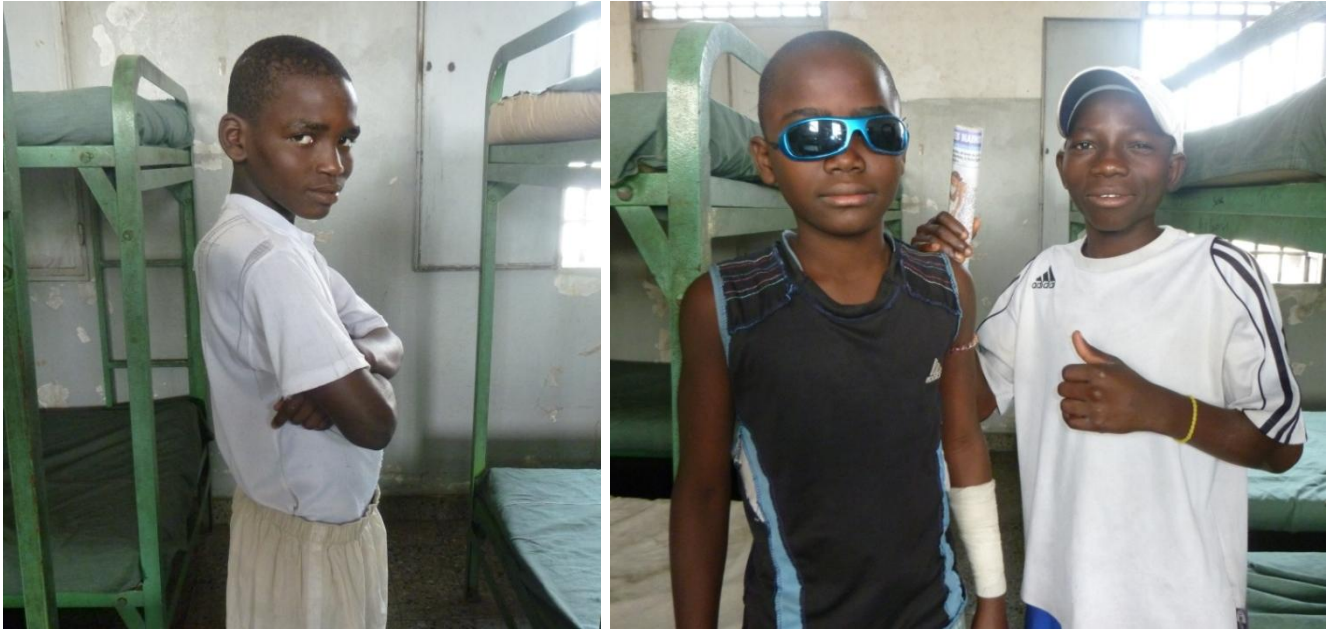
Niños residentes en “Home Augustin Modjipa” (centro cerrado), para niños de 13 a 16 años. Fotos hechas por ellos mismos. 13/8/2013