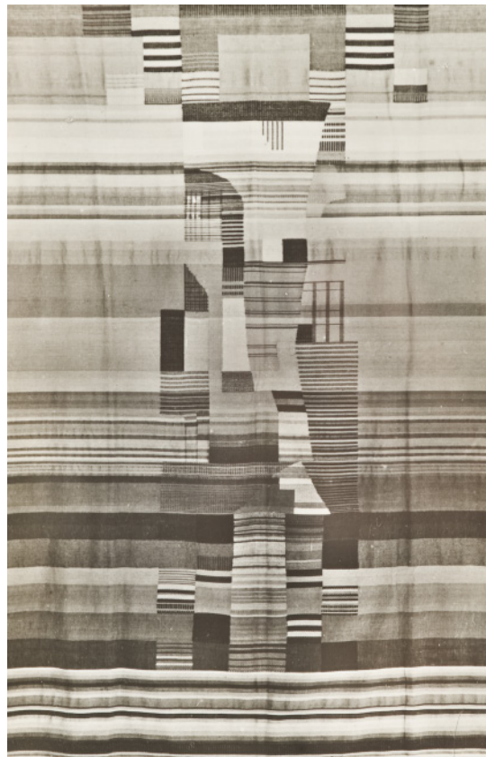
Fotografía de una alfombra de Gunta Stölzl. Erich Consemüller. Dessau, 1927. Gelatina de plata sobre papel. MNAD (CE25054)

La alfombra (CE25087) responde a este contexto, ya que fue realizada entre 1919 y 1925 bajo el marco de la Bauhaus de Weimar. Es un tejido compuesto por una urdimbre de fibras de algodón y rayón verde y fibra de celulosa beis. Sobre esta se dispusieron las tramas para formar el tejido con fibras de lana beis, negro, naranja y gris. La solución de esta composición es una alfombra con flecos en los extremos