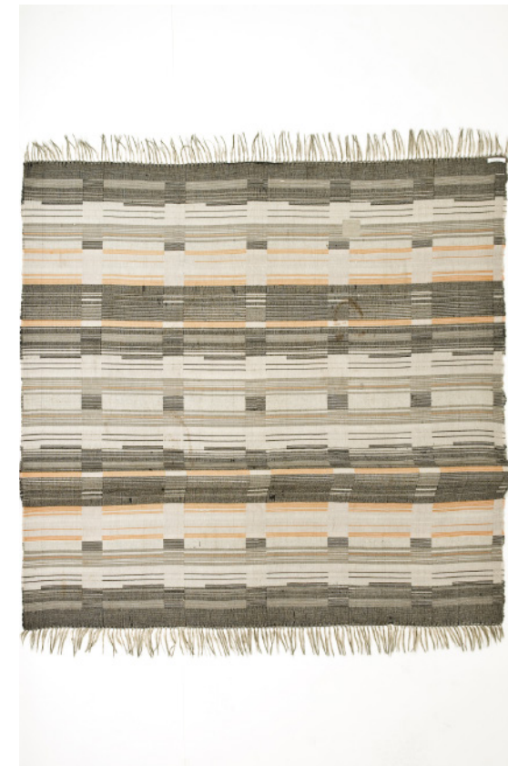
Alfombra. Gunta Stölzl (diseño). Bauhaus de Weimar, 1919-1925. Fibras de algodón, celulosa regenerada (rayón) y lana tejidas. MNAD (CE25087).

Asimismo, esta pieza se presenta como un ejemplo material que nos posibilita analizar la Bauhaus desde otra perspectiva. Dos mujeres y un diseño nos permite aproximarnos a las creadoras que formaron parte de la escuela porque de lo que no se habla, se olvida; y lo que se olvida, se margina.