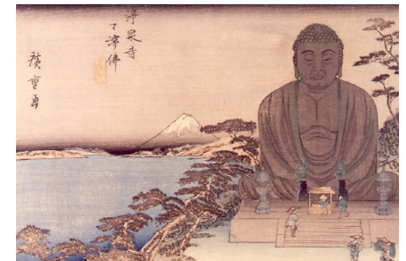
Gran buda de Kamakura en Josen-ji , templo de la secta budista Zen. Ando Hiroshige, Japón, 1830. Xilografía policroma ( nishiki-e ) sobre papel. MNAD (CE10831)

Este fue el caso de El Gran Buda de Kamakura (CE10831), estampa que representa un famoso templo dentro de la prefectura de Kanagawa. Este lugar se encontraba en una desviación de la ruta Tōkaidō, una de las vías de comunicación más importantes de Japón. La estampa de Ando Hiroshige presenta elementos fácilmente reconocibles, como el Monte Fuji. Gracias a las fukei-hanga , el volcán terminó consolidándose como símbolo nacional de Japón.