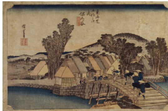
Hodogaya-juku . Cuarta estación de la serie 53 estaciones del Tokaido . Ando Hiroshige, Japón, 1833-34. Xilografía policroma ( nishiki-e ) sobre papel. MNAD (CE10763)

las imágenes de cortesanas, geishas y actores (ej. onnagata ) fueron prohibidas, tras al menos una década de críticas y desgaste en la opinión pública. Por ende, los artistas fijaron su mirada en otros temas que pudieran pasar los filtros de la censura. Fue entonces cuando emprendieron la búsqueda de una nueva temática y recordaron aquello que siempre había caracterizado a la cultura japonesa: el gusto por la naturaleza.