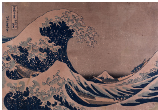
Bajo la ola de Kanagawa o La Gran Ola de Kanagawa . Primera estampa de la serie 36 vistas del monte Fuji . Katsushika Hokusai, Japón, 1831-33. Xilografía policroma ( nishiki-e ) sobre papel. MNAD (CE10829)

El incremento de la presencia de esta temática coincidió con un aumento en los viajes y peregrinaciones, únicos entretenimientos legítimos a los cuales tenía acceso la población. Las estampas de paisajes, conocidas como fukei-hanga , centraron su atención en diferentes elementos de la naturaleza. Su objetivo era difundir los principales puntos de interés de las ciudades. En ocasiones, estos grabados mostraron una visión idílica que, a modo de marketing de la época, trataba de publicitar la ciudad para fomentar su visita.