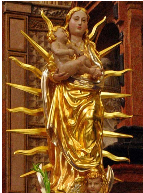
Fig. 6. Virgen de Linares , ss. XV-XVI. Santuario de Nuestra Señora de Linares (Córdoba). http://forosdelavirgen.org/145/nuestra-senora-de-linares-espana-29-de-junio/

Ntra. Sra. del Castillo de Fuente Obejuna (Córdoba), siendo la imagen de procedencia flamenca 45 (fig. 5). En ambos casos, las esculturas presentan atributos apocalípticos, tales como hallarse rodeadas de rayos flamígeros y pisando la luna. Importada de Flandes 46 , la apariencia de la mujer vestida de sol, aplicada a esta representación iconográfica de la Asunción, fue sumamente popular en los reinos de España, convirtiéndose en la representación asuncionista más característica. De hecho, cuando el tratadista jesuita Juan Molanus intenta describir la apariencia que debe tener la representación de la Virgen asunta remite al modelo español para fijar su iconografía de forma definitiva 47 .