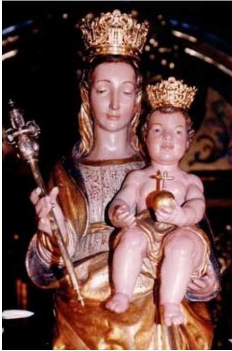
Fig. 11. Virgen de la Cabeza , ppios. s. XVI. Santuario de Nuestra Señora de la Cabeza (Motril, Granada).

http://www.rafaes.com/html-2004/patrona-motril.htm