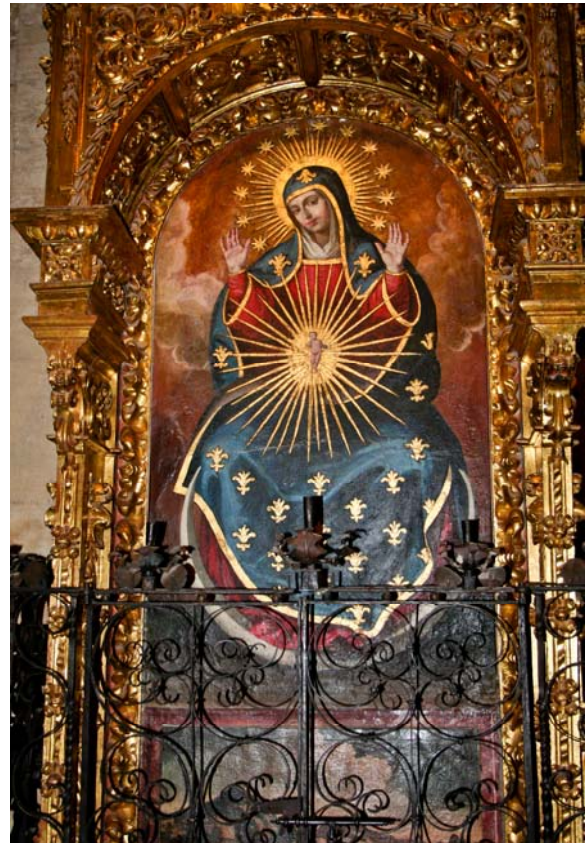
Fig. 3. Virgen del Sol , h. 1433-1465. Mezquita-Catedral (Córdoba).

otro posiblemente sea San Gabriel, pues porta una cartela que dice "CONCEPTIO TUA DEI GENITRIX V[IR]GO" y sujeta la luna bajo los pies de la Virgen. Esta sostiene al Niño que la mira candorosamente mientras agarra una rosa roja que sujeta su Madre, -que hace referencia a la futura Pasión de su Hijo 39 - y la cual se halla coronada por partida doble: con una corona real y con las doce estrellas de rigor. Todo este conjunto se destina a exaltar el papel intercesor de María, como Reina de todo lo creado y Madre de Dios. No obstante, la presencia de San Rafael y Tobías, cuya introducción en la obra pudiera hacer referencia a la historia del demonio Asmodeo, -el cual fue alejado de la futura mujer de Tobías, pues este mataba a todos sus esposos por estar enamorado de ella-, así como la de los ángeles músicos nos retrotrae, de una forma más críptica aún, al propio pasaje del Apocalipsis donde la Mulier amicta sole huye de la bestia dracontiforme y da a luz a un hijo, mientras San Miguel vence al dragón.