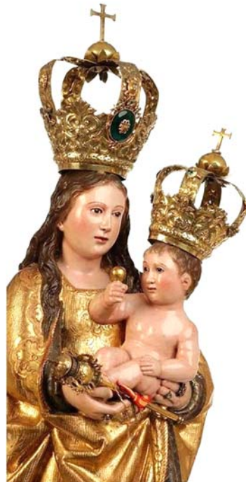
Fig. 12. Virgen de los Remedios , ss. XV-XVI. Santuario de Nuestra Señora de los Remedios (Antequera, Málaga).

http://www.rafaes.com/html-2004/patrona-motril.htm