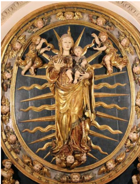
Fig. 8. ¿Diego Guillén Ferrant?, Virgen de la Granada , s. XVI. Colegiata de Santa María de la Asunción (Osuna, Sevilla).

En pleno siglo XVI, y aun cuando los atributos apocalípticos ya eran, prácticamente, asimilados en la iconografía de la Tota Pulchra , símbolo del futuro dogma de la Inmaculada Concepción de la Virgen María, estos mismos seguían siendo usados en imágenes marianas que, en principio, no venían a destacar este hecho, y, sí, más bien, a encumbrar otros valores simbólicos. Empero, estos atributos se difundirán ampliamente desde mediados del s. XVI hasta finales del s. XVIII, sobre todo en aquellas imágenes de la Virgen que eran sobrevestidas (ya fueran porque, en principio eran de talla y se modernizaban al gusto de la época) o que eran de vestir directamente. Seguramente, los mismos fueran insertos como complementos simbólicos de la Virgen por tradición, por exaltación del boato y lujo, a fin de acrecentar la apariencia extraterrenal de la imagen, por querer