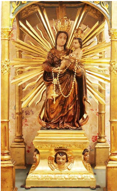
Fig. 7. Virgen del Rosario , ss. XV-XVI. Iglesia de Nuestra Señora del Rosario (Peñarroya-Pueblonuevo, Córdoba).

La Virgen porta al Niño Jesús en su seno que, recostado, apoya su brazo sobre sus pechos y la mira con filial ternura. La efigie mariana, por su parte, presenta rayos flamígeros que circundan sus costados, media luna a sus pies, del que asoma la cabeza de un querubín y vestiduras completamente doradas que la