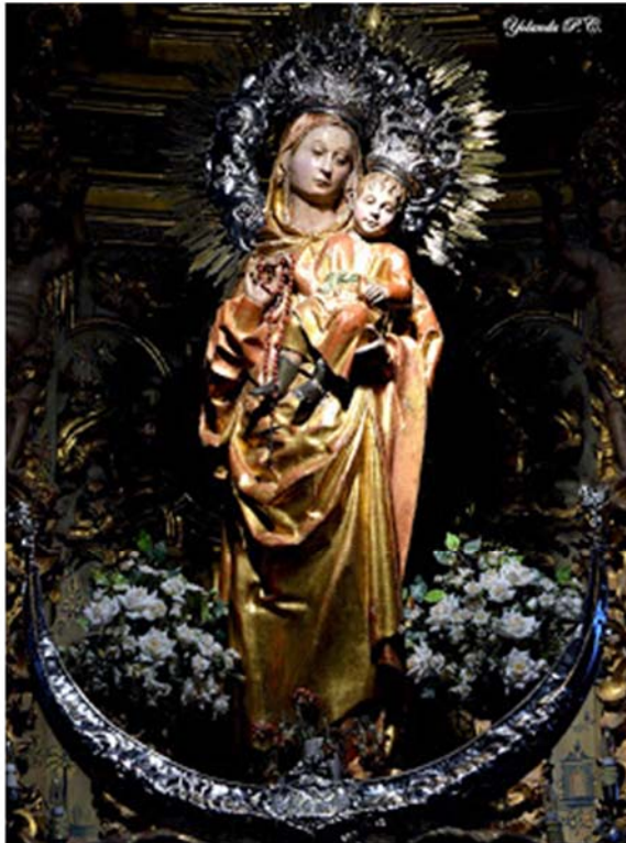
Fig. 9. Círculo de Pedro Millán, Virgen del Rosario , 1510. Iglesia de Santo Domingo (Écija, Sevilla).

Virgen del Rosario de Peñarroya-Pueblonuevo y la Virgen de la Granada de la Colegiata de Osuna.