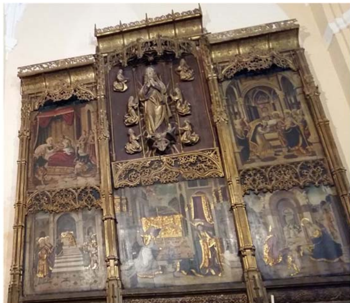
Fig. 5. Virgen de la Asunción , ppios. s. XVI. Iglesia de Nuestra Señora del Castillo (Fuente Obejuna, Córdoba).

https://upload.wikimedia.org/wikipedia/commons/5/5e/Altar_mayor_catedral_fl-2011-05-02.jpg