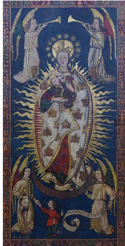
Fig. 2. Puerta izq. del coro bajo, 1470-1490. Iglesia del Monasterio de Santa Clara (Moguer, Huelva).