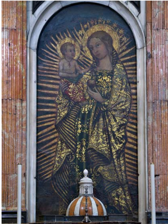
Fig. 1. Petrus de Ebulo, Liber ad honorem Augusti sive de rebus Siculis , 1196.

Burgerbibliothek (Berna, Suiza), Ms. 120 II, fol. 95r.