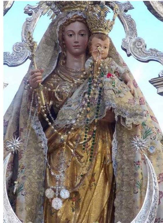
Fig. 10. Juan Vázquez de Vega, Virgen del Rosario , 1587. Iglesia de Santo Domingo (Antequera, Málaga).

http://dondepiedad.blogspot.com.es/2011/08/la-virgen-del-rosario-de-ecija.html