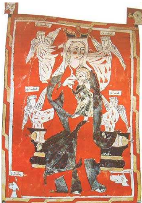
Virgen de la leche. Carta de fundación de la Cofradía de la Virgen María y Santo Domingo de la iglesia de Tárrega (Lérida), 1269, miniatura sobre pergamino. Barcelona, ACA.

http://corsair.morganlibrary.org/icaimages/6/m612.001v.jpg [captura 27/3/2013]