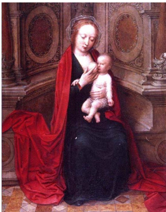
Adriaen Isenbrant, La Virgen del sitial de mármol , primera mitad del siglo XVI, óleo sobre tabla. Madrid, Museo Lázaro Galdiano.

http://www.cult.gva.es/mbav/data/0294.jpg [captura 27/3/2013]