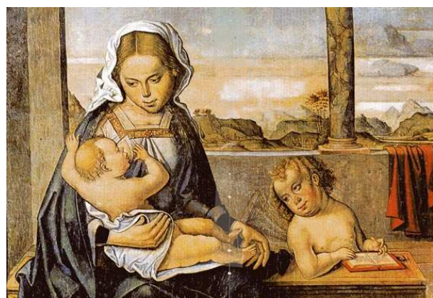
Maestro de Astorga, Sagrada Familia con san Juanito , c. 1530, temple y óleo sobre tabla (detalle). Barcelona, MNAC.