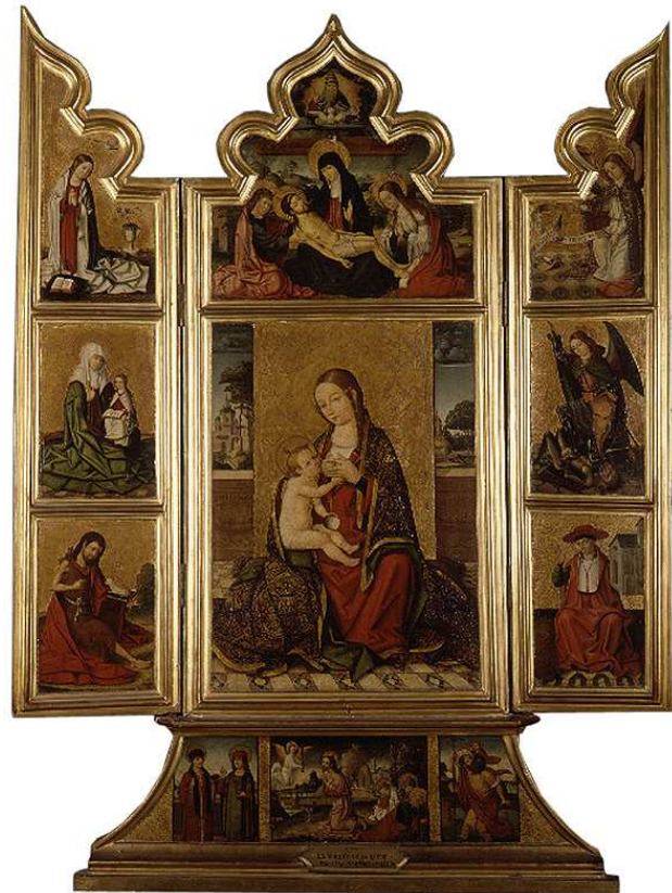
Nicolás Falcó, Tríptico de la Virgen de la leche , c. 1500, óleo sobre tabla. Valencia, Museo de Bellas Artes.

http://4.bp.blogspot.com/-digndpG3YBA/T125B12zzBI/AAAAAAAAAKQw/kF67vFY2Q3Q/s1600/Virgen+amamantando.jpg [captura 27/3/2013]