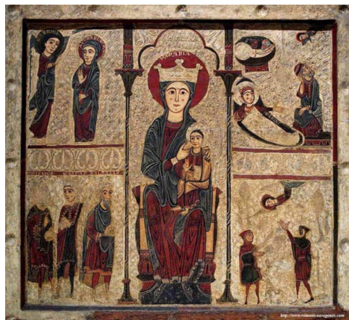
Frontal de Betesa (Huesca, España), segunda mitad del siglo XIII, estuco y temple sobre tabla. Barcelona, MNAC.

http://www.art-breastfeeding.com/re11/images/image-34.jpg [captura 27/3/2013]