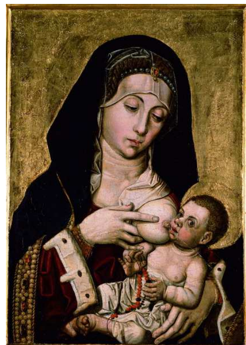
Bartolomé Bermejo, Virgen de la Leche , c. 1465, óleo sobre tabla. Valencia, Museo de Bellas Artes.

http://commons.wikimedia.org/wiki/File:Jean_Fouquet_005.jpg [captura 27/3/2013]