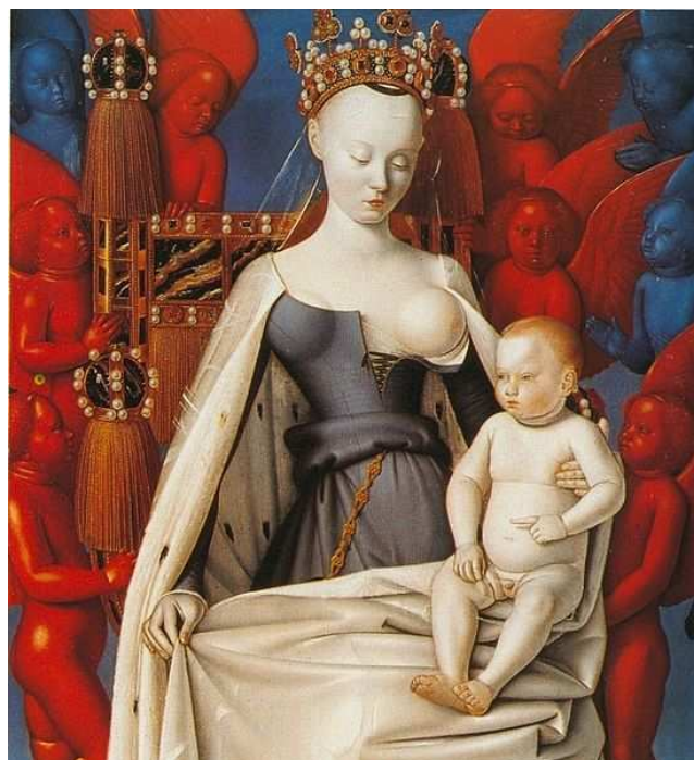
Jean Fouquet, Díptico de Melun , c. 1452-1455, óleo sobre tabla, panel derecho. Amberes, Museo Real de Bellas Artes.

https://commons.wikimedia.org/wiki/File:Robert_Campin_005.jpg [captura 27/3/2013]