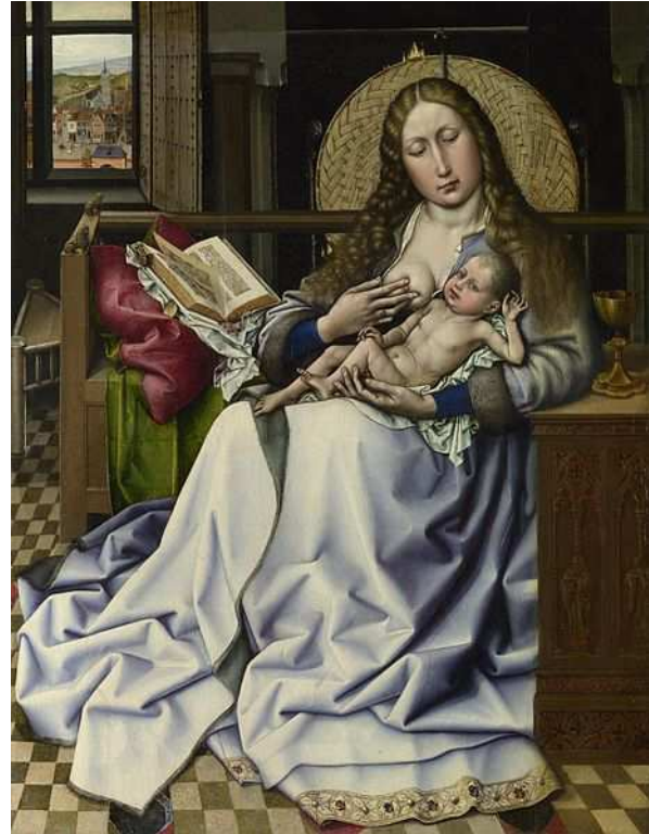
Robert Campin, Virgen con Niño , c. 1440, óleo sobre tabla. Londres, National Gallery.

http://art-breastfeeding.com/re11/images/image-50.jpg [captura 27/3/2013]