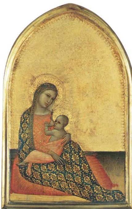
◀ Ghissi Francescuccio, Virgen de la Humildad , segunda mitad del siglo XIV, temple sobre tabla. Roma, Museos Vaticanos.

http://www.zeno.org/Kunstwerke/images/1/77j057b.jpg?w=500&h=778&vid=100341639 [captura 27/3/2013]