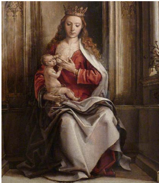
Pedro Berruguete, Virgen con el Niño , c. 1500, óleo sobre tabla (detalle). Madrid, Museo Municipal.

http://4.bp.blogspot.com/-digndpG3YBA/T125B12zzBI/AAAAAAAAAKQw/kF67vFY2Q3Q/s1600/Virgen+amamantando.jpg [captura 27/3/2013]