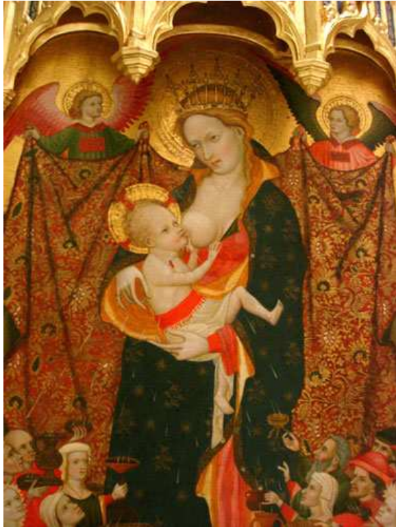
Antoni Peris, Retablo de la Virgen de la Leche , c. 1415, temple sobre tabla (detalle). Valencia, Museo de Bellas Artes.