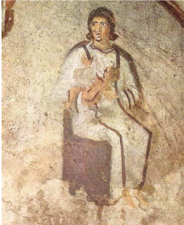
Virgen con Niño, c. 255, fresco. Roma, Catacumba de Priscila, cubículo de la Velatio .