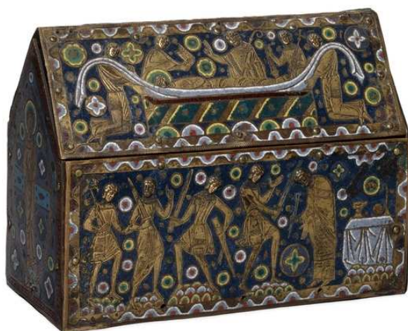
Arqueta relicario de cobre y esmalte, Limoges (Francia), finales del siglo XII. Londres, The British Museum.

http://www.britishmuseum.org/images/ps335217_1.jpg [captura 31/3/2013]