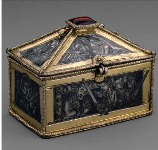
Relicario inglés en plata nielada, c. 1173-1180. Nueva York, The Metropolitan Museum of Art.

http://www.metmuseum.org/toah/images/hb/hb_17.190.520.jpg [captura 31/3/2013]