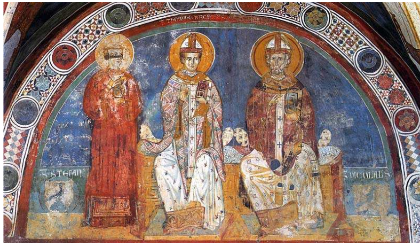
Santo Tomás Becket entre San Esteban y San Nicolás. Pinturas murales del monasterio de Subiaco (Italia), primera mitad del siglo XIII.