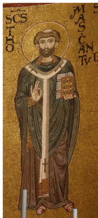
▲ Santa María de Tarrasa (Barcelona, España), pinturas murales de la zona inferior del ábside, finales del siglo XII.