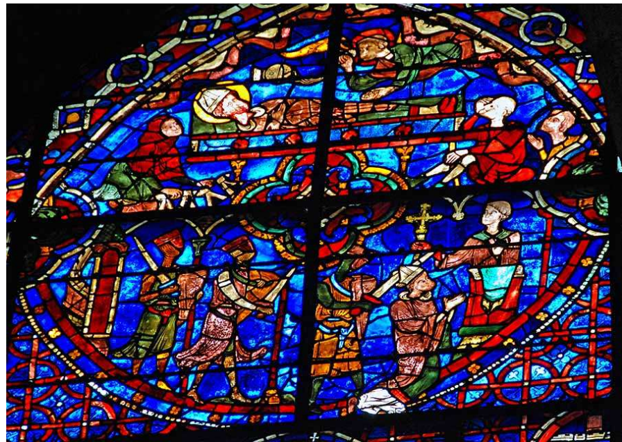
◀▲ Vidriera de la vida de Tomás Becket, capilla del deambulatorio de la catedral de Chartres (Francia), c. 1215-1225; detalle del martirio y cuerpo del santo.

http://www.medievalart.org.uk/Chartres/18_pages/jpeg_800/Chartres_Bay_18_Becket_Full.jpg ; http://www.paradoxplace.com/Photo%20Pages/France/Chartres/Becket_Window/Images/900/GMurder-Sept07-DE6567sAR900.jpg [capturas 31/3/2013]