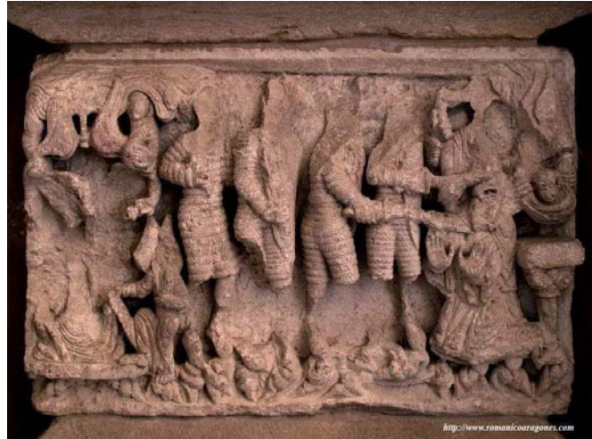
Frontal pétreo de altar de la iglesia de San Miguel de Almazán (Soria, España), finales del siglo XII.