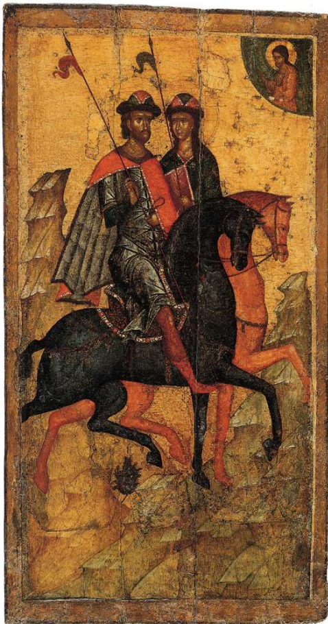
Santos Boris y Gleb, primera mitad del siglo XIV. Pintura sobre tabla. Moscú, Galería Tretyakov.

http://www.flickr.com/photos/theheartindifference/4172595286/ [captura 31/05/2010]