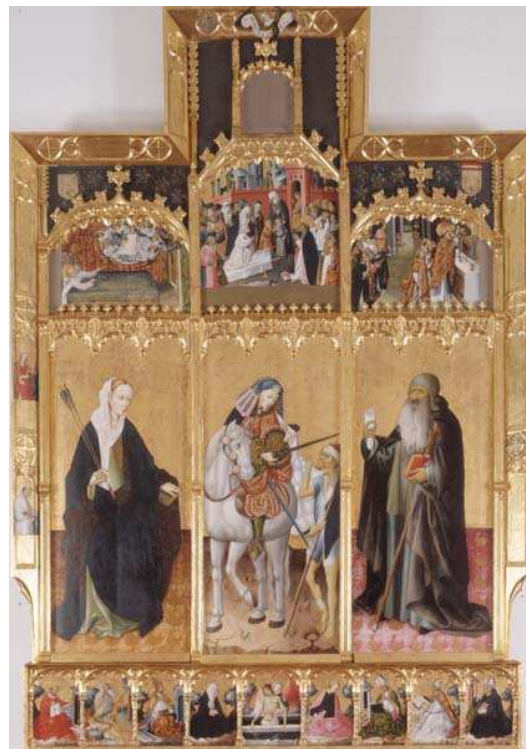
Gonçal Peris, Retablo de San Martín, Santa Úrsula y San Antonio, 314x260 cm. Temple sobre tabla. Valencia, Museo de Bellas Artes.

http://upload.wikimedia.org/wikipedia/commons/2/20/Simone_Martini_033_bright.jpg [captura 31/05/2010]