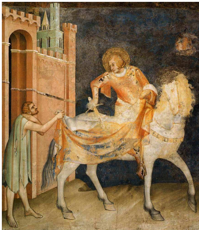
Simone Martini, San Martín parte su capa con un pobre, 1317-1319. Pintura al fresco. Asís, iglesia inferior de San Francisco, capilla de San Martín.

http://www.museoferias.net/fotos5/SantiagoMatamoros.jpg [captura 31/05/2010]