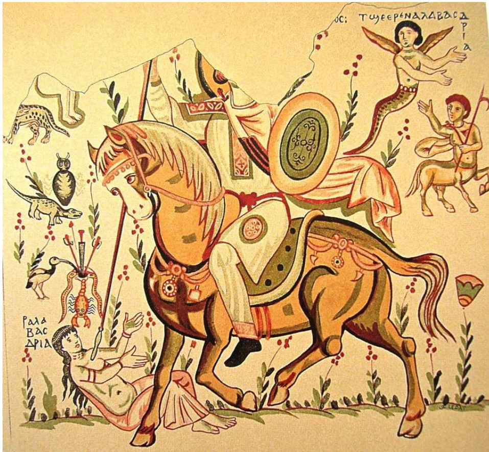
San Sisinio mata a la diablesa Albasdria, siglos VI-VII. Dibujo de J. Clédart a partir de una pintura mural, Convento de Bawit (Egipto).