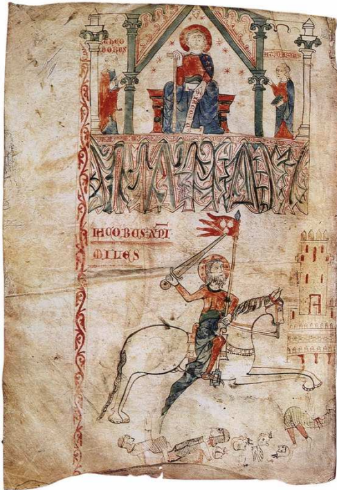
Santiago matamoros. Tumbo B, 1326, fol. 2v. Archivo de la Catedral de Santiago de Compostela.

[Compostela y Europa. La historia de Diego Gelmírez (2010). Skira, Milán, p. 155]