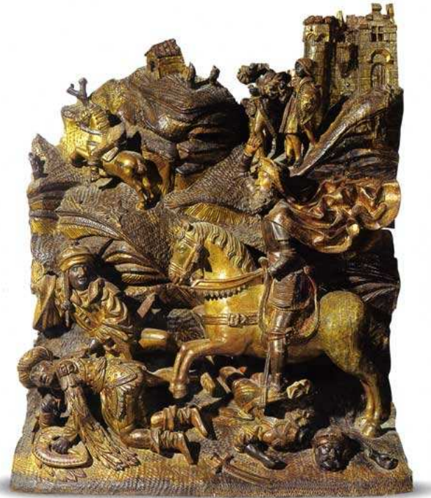
Santiago matamoros, ca. 1515. Escultura en madera. Retablo de San Martín, iglesia de Santiago Apóstol, Medina del Campo, Valladolid.

[Compostela y Europa. La historia de Diego Gelmírez (2010). Skira, Milán, p. 155]