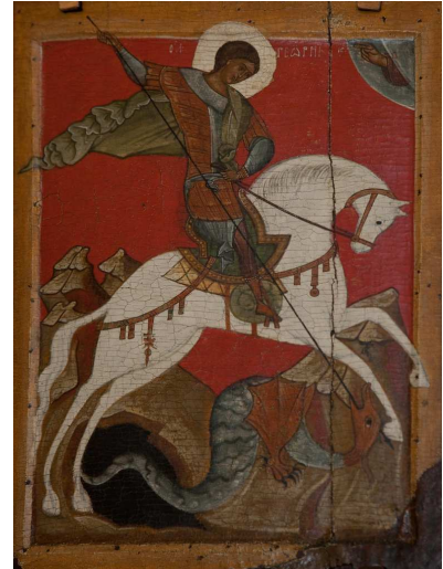
San Jorge, siglo XIV. Pintura sobre tabla, escuela de Novgorod. San Petersburgo, Museo Estatal Ruso.

http://www.flickr.com/photos/theheartindifference/4172595286/ [captura 31/05/2010]