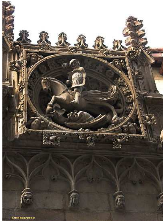
Pere Joan, San Jorge, ca. 1420. Escultura en piedra. Barcelona, Palau de la Generalitat.