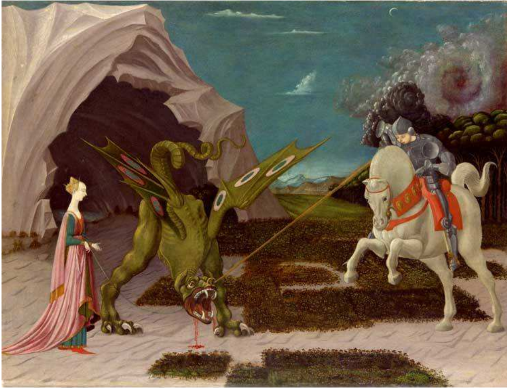
Paolo Uccello, San Jorge y el dragón , 1470. Temple sobre tabla. Londres, National Gallery.

http://upload.wikimedia.org/wikipedia/commons/archive/e/ed/20100527134131!Paolo_Uccello_047b.jpg [captura 31/05/2010]