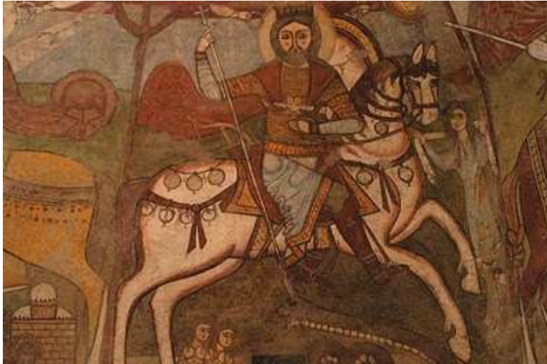
San Teodoro el Anatólio, siglo XI. Pintura mural, Convento de San Antonio, Egipto.