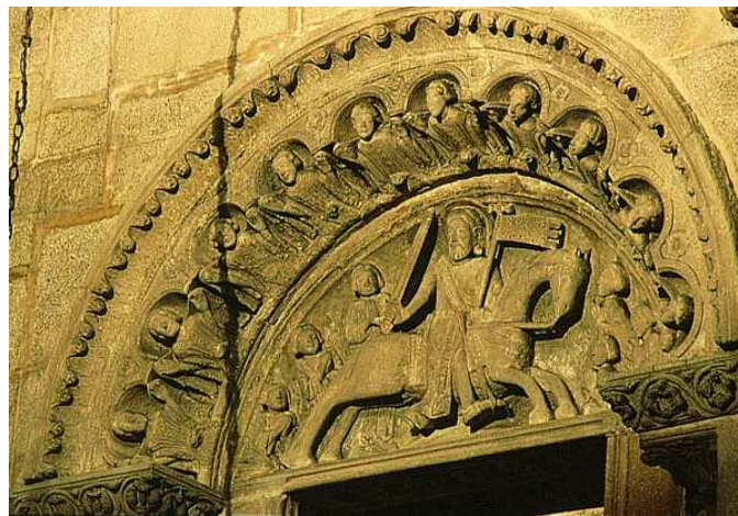
▲ Santiago matamoros en la batalla de Clavijo, primer tercio del s. XIII. Escultura en piedra. Tímpano en el brazo sur del crucero de la catedral de Santiago de Compostela.

http://cvc.cervantes.es/actcult/camino_santiago/decimotercera_etapa/santiago/01_clavijo.htm [captura 31/05/2010]