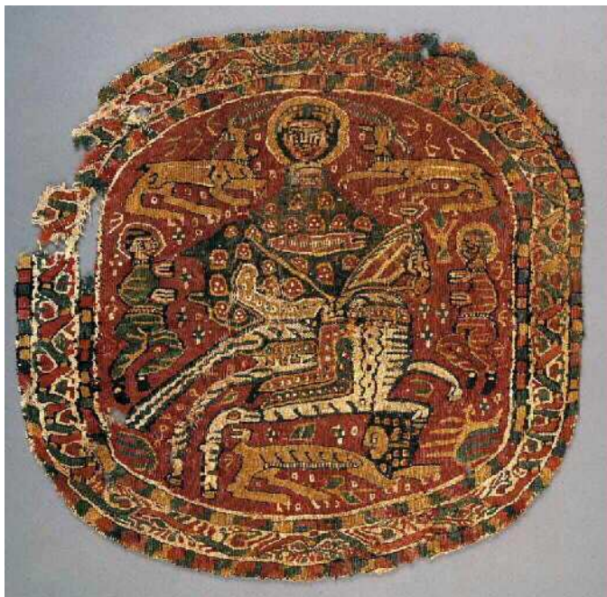
Santo caballero, siglos IX-X. Tejido procedente del Valle del Nilo, lino y lana, 33x34 cm. Rouen, Musée départemental des Antiquités, n° inv, 2481A.2 (D), 140 (coll. tissus coptes), 8 (n° Cat. Cent. chefs-d'oeuvre).