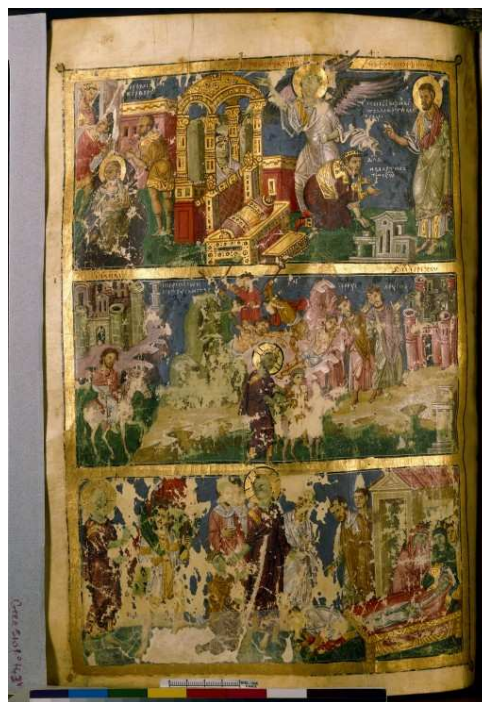
Los reproches de Natán (escena derecha del registro superior del folio).