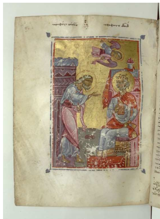
Los reproches de Natán.

http://visualiseur.bnf.fr/Visualiseur?Destination=Mandragore&O=07919835&E=1&I=97550&M=imageseule [captura 20/11/2009]