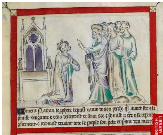
Los reproches de Natán.

Salterio de la Reina María de Inglaterra, Inglaterra, ca. 1310-1320. Londres, The British Library, Ms. Royal 2 B VII, fol. 58.