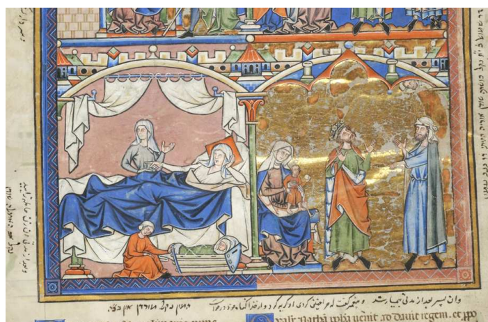
Los reproches de Natán (escena derecha).

http://utu.morganlibrary.org/medren/BooleanSearchResults.cfm?imagenname=m739.017vc.jpg&page=ICA000097652&subject1=David&boolean=AND&subject2=nathan&totalcount=19&current=17 [captura 20/11/2009]