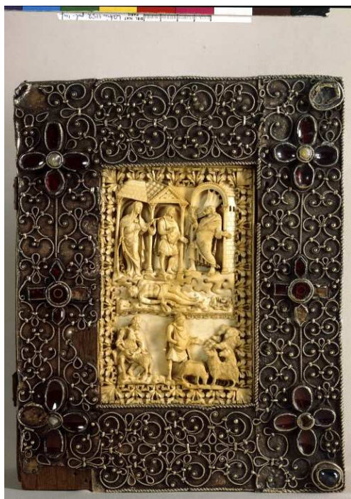
Los reproches de Natán y la parábola del hombre rico y el hombre pobre.

Cubierta del Salterio de Carlos el Calvo, Metz (Francia), s. IX. París, BnF, Ms. Lat. 1152.