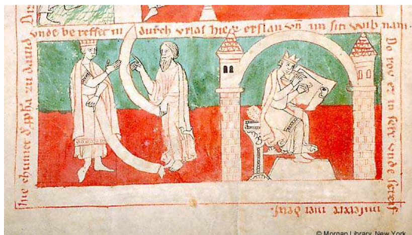
Los reproches de Natán (escena izquierda).

Libro de Horas. Bamberg (Alemania), s. XIII. Nueva York, Pierpont Morgan Library, Ms. M. 739, fol. 17v.