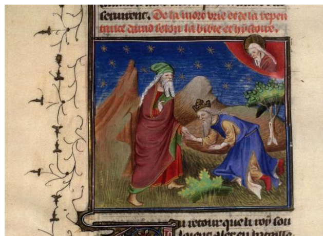
Los reproches de Natán.

http://www.bl.uk/catalogues/illuminatedmanuscripts/ILLUMIN.ASP?Size=mid&IID=31382 [captura 20/11/2009]