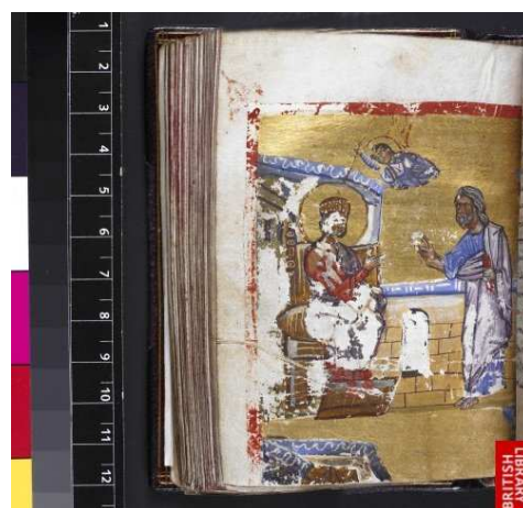
Los reproches de Natán.

http://utu.morganlibrary.org/medren/BooleanSearchResults.cfm?imagenname=m638.042vb.jpg&page=ICA000077792&subject1=David&boolean=AND&subject2=nathan&totalcount=19&current=10 [captura 20/11/2009]