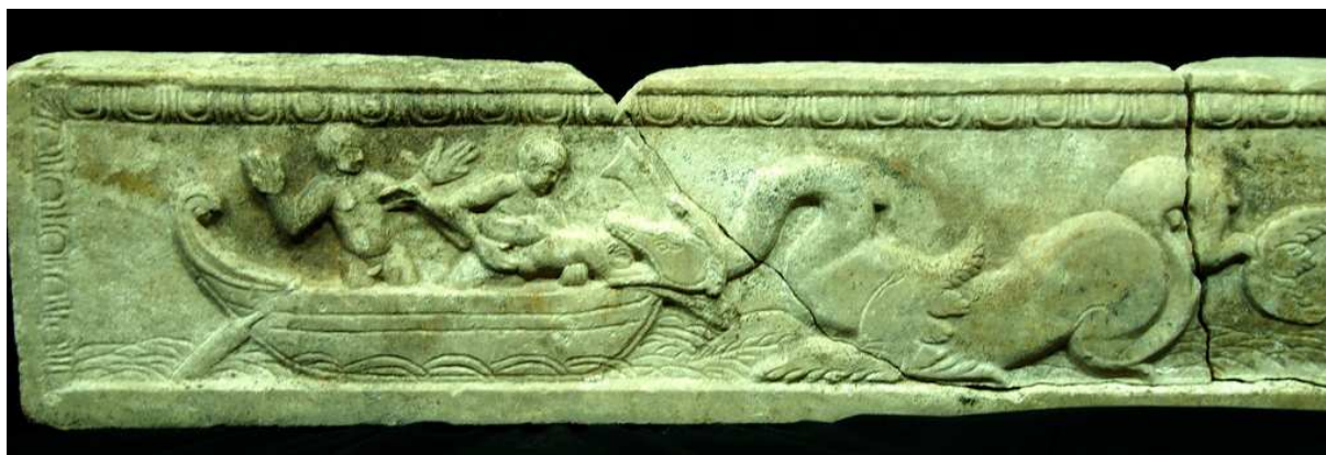
Sarcófago de Jonás, s. IV, mármol, Parque Arqueológico de Carranque, Toledo (España).