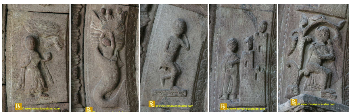
Ciclo de Jonás, sexta arquivolta de la portada occidental del Monasterio de Ripoll, Gerona (España), s. XII. De izquierda a derecha: Jonás recibiendo la orden divina; Jonás arrojado al mar; Jonás arrojado a la playa por la ballena; Predicación de Jonás en Nínive; Jonás descansando a las afueras de Nínive.

http://www.flickr.com/photos/gabillo/4141319307/sizes/l/ [captura 20/11/2009]