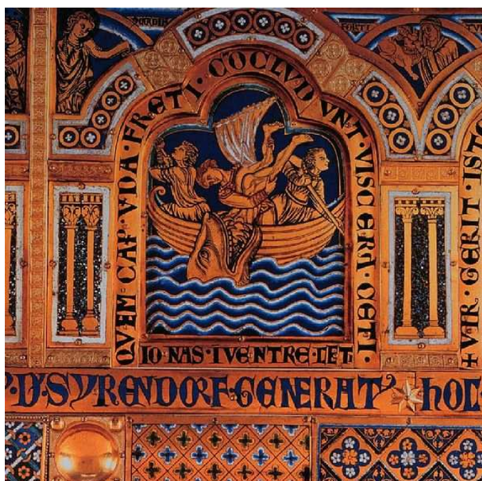
Nicolás de Verdún, Tríptico de Klosterneuburg, Jonás lanzado al mar, 1181, esmaltes campeados sobre cobre. Monasterio de Klosterneuburg (Austria).

http://www.romanicocatalan.com/Ripolles/ripoll/Ripoll-archivos/Ripoll127.JPG ; http://www.romanicocatalan.com/Ripolles/ripoll/Ripoll-archivos/Ripoll128.JPG [capturas 20/11/2009]