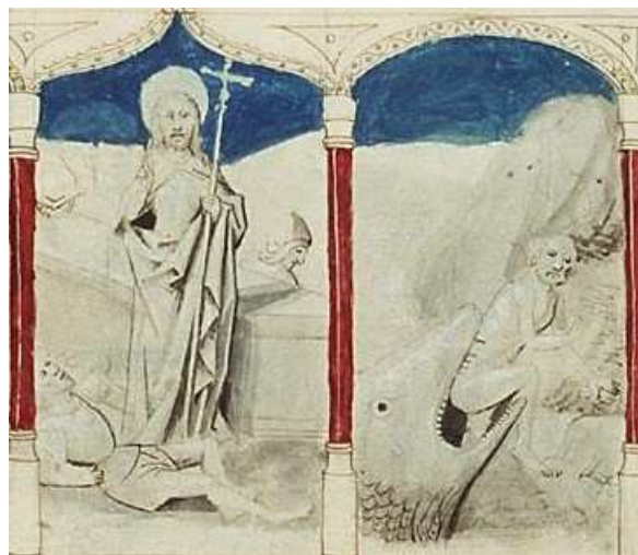
Jonás arrojado al mar y Cristo depositado en el sepulcro / Jonás sale del vientre de la ballena y resurrección de Cristo. Biblia Pauperum, 1450-1455, manuscrito MMW, 10A15, Biblioteca Nacional de Holanda, La Haya.

http://www.xtec.cat/sgfp/licencias/200203/memories/prodriguez/antiguotestamento/jonaspauperum.htm [capturas 20/11/2009]