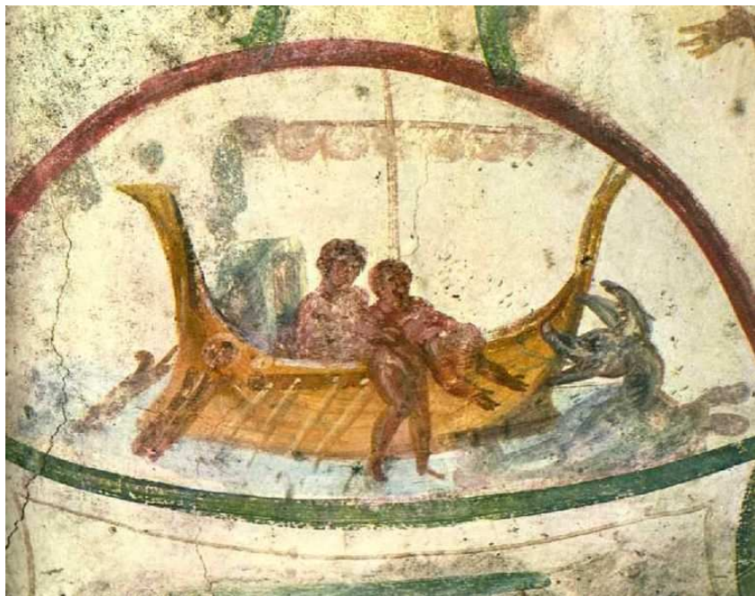
◀ Jonás lanzado al mar, s. IV, pintura al fresco, Catacumba de los Santos Pedro y Marcelino, Roma (Italia).

http://en.wikipedia.org/wiki/File:Jonah_thrown_into_the_Sea.jpg [captura 20/11/2009]