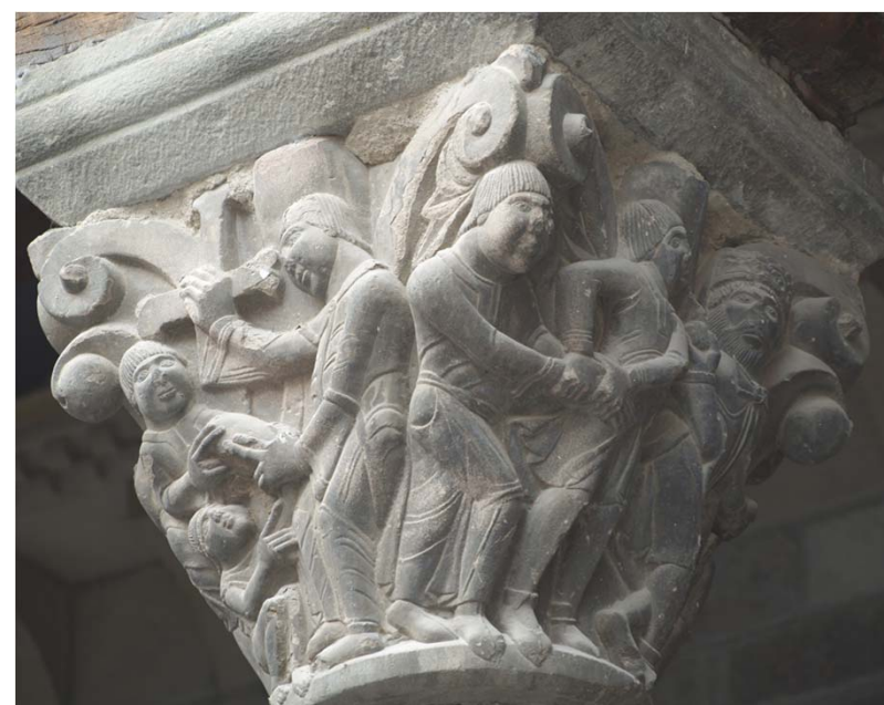
Capitel con la historia de san Lorenzo y san Sixto posiblemente procedente del coro de canónigos de la catedral de Jaca. Pórtico meridional de la catedral de Jaca