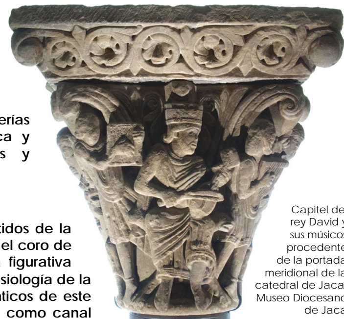
Capitel del rey David y sus músicos procedente de la portada meridional de la catedral de Jaca. Museo Diocesano de Jaca

Los umbrales catedralicios de Jaca materializaron discursos que articulan el lugar central y los cometidos de la monarquía en la sociedad, la voluntad de reforma eclesiástica y la propaganda religiosa, mientras que el coro de canónigos acogió imágenes hagiográficas alusivas al carisma propio del clero regular. Esta cultura figurativa inédita en el territorio aragonés proclamó, desde una óptica clerical, principios fundamentales de la eclesiología de la reforma y aspiró a definir el papel de la monarquía y sus relaciones con la Iglesia. Los perfiles semánticos de este imaginario apelaron al Antiguo Testamento, al paradigma de Constantino, a la epigrafía monumental como canal complementario difusor de mensajes y a una hagiografía portadora de valores modélicos y relecturas de la historia. Su génesis y recepción cobran sentido en el seno de una comunidad regular presidida por un obispo de formación monástica, Pedro (1086-1099), adepto a las elites impulsoras de la reforma en el reino.