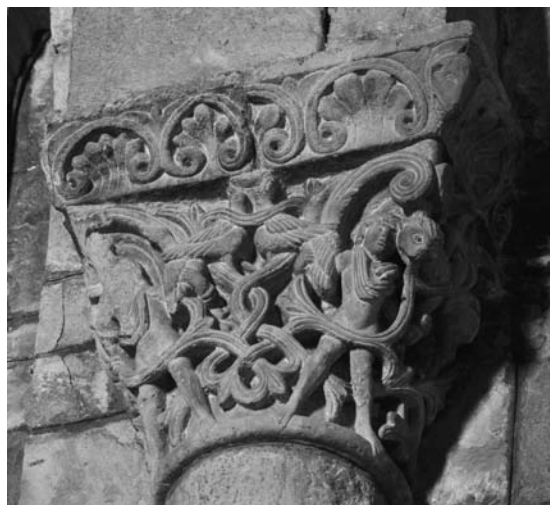
Fig. 7: Catedral de Jaca (Huesca). Interior, jóvenes entre maraña vegetal.

así como de otros en los que el difunto, en imago clipeata , es elevado al cielo por genios alados, puesto que su conocimiento por parte del escultor jaqués es innegable a la luz de capiteles como el del Sacrificio de Isaac , o el de la evocación del alma santificada elevada al cielo en el interior de la catedral; cestas en las que el tallista no tuvo sino que reactualizar las antiguas composiciones moralizando los significados, dando lugar a piezas formalmente próximas al modelo, pero radicalmente distantes en cuanto a contenido.