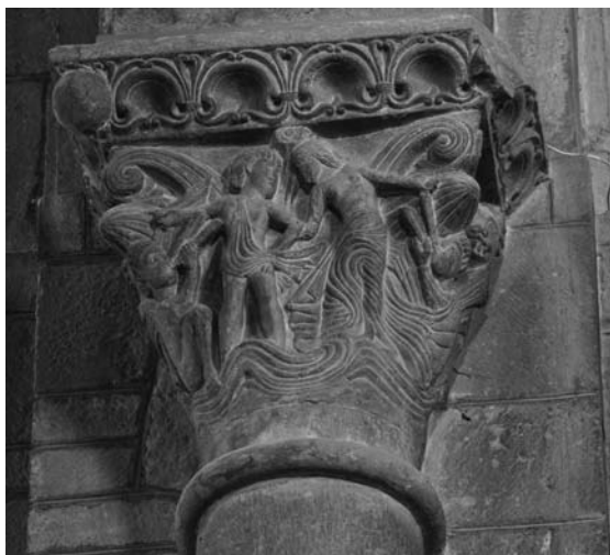
Fig. 6: Catedral de Jaca (Huesca). Interior, capitel marino.