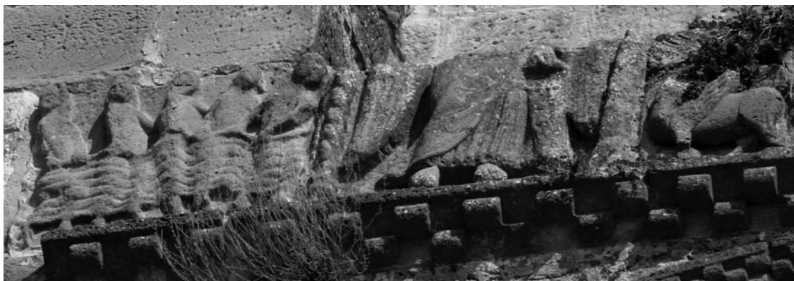
Fig. 5: Castillo de Loarre (Huesca). Friso sobre la portada de acceso.