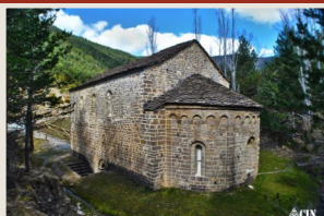
Ermita de San Adrián de Sasabe- Huesca- Aragón

Las comunicaciones deberán ser enviadas por e-mail: icctour2015@gmail.com