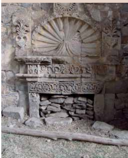
Nicho decorado de la iglesia Märtula Maryam.