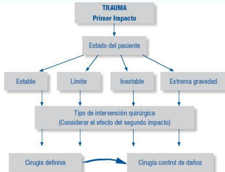
Figura 1. Protocolo para la aplicación del control de daños