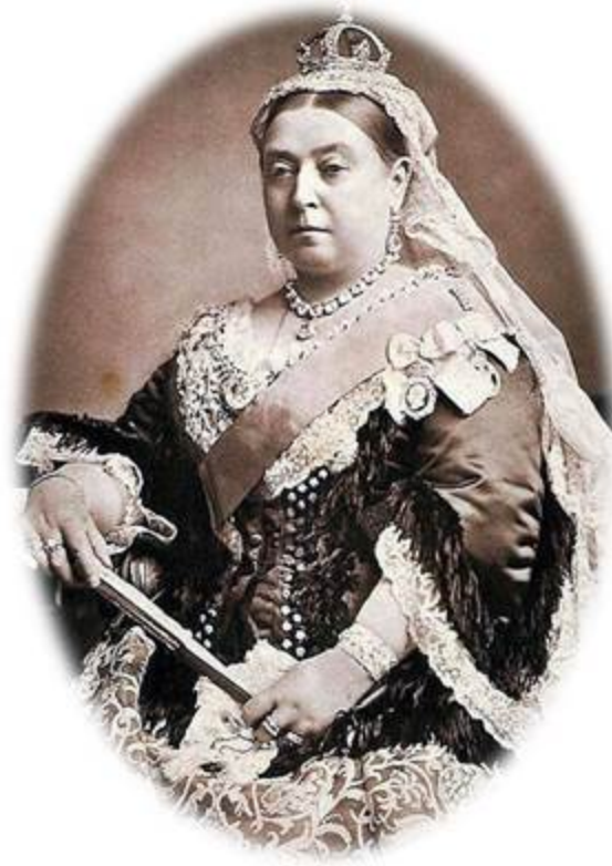
La reina Victoria I de Inglaterra en 1887, cuando se cumplía medio siglo de su llegada al trono.