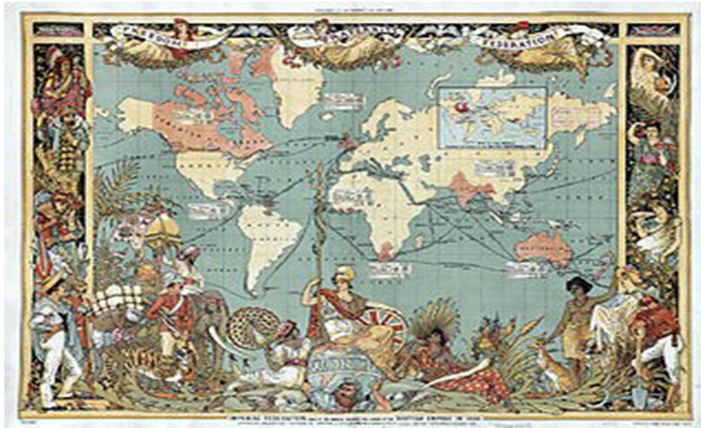
El Imperio Británico en 1886, en rosa, que era el color en que se coloreaban los dominios británicos en los mapas. Walter Crane

El extenso imperio británico comenzó a formarse en el siglo XVIII y alcanzó la madurez durante el largo reinado de Victoria I (1837-1901) , impulsado por la acción de eficientes ministros como Disraeli o Gladstone. Hasta entonces había controlado fundamentalmente territorios costeros o islas con claras aspiraciones comerciales o estratégicas . Algunos de ellos habían pertenecido a Francia, Holanda o España: El Cabo en el Sur de África, la isla de Ceilán en el Índico, Malta y Corfú en el Mediterráneo, Gibraltar y Santa Elena en el Atlántico, etc. La derrota de Napoleón reforzó su posición dominante.