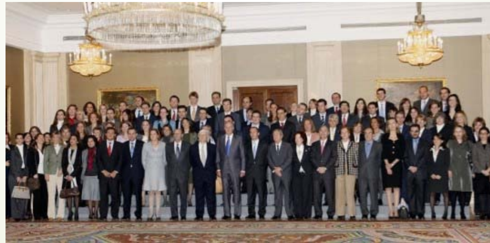
Asociación Profesional de Inspectores de Seguros del Estado APISE