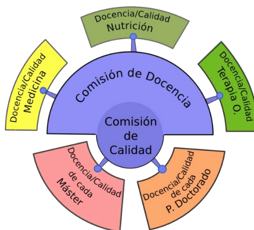
Figura 1. Estructura del Sistema de Garantía Interna de Calidad de la Facultad de Medicina

con carácter trimestral, de las que al menos dos de ellas serán presenciales. La Convocatoria se realiza con al menos 48 horas de antelación y en ella se incluye el orden del día previsto y la documentación correspondiente, siendo remitidos por medios electrónicos. Para la reunión en sesiones extraordinarias, se requiere la iniciativa del Presidente o la solicitud de un mínimo del 20% del total de miembros. La convocatoria de estas sesiones se realizará con una antelación mínima de 24 horas y contendrá el orden del día de la reunión. La toma de decisiones se lleva a cabo por asentimiento o, en su caso, por mayoría simple, quedando reservado el voto de calidad al Presidente. En caso de reunión electrónica, se consideran como asistentes al total de los miembros de la Comisión y la mayoría simple se considera sobre el conjunto de los mismos. Los acuerdos y decisiones adoptados por la Comisión de Calidad se elevan a la Junta de Facultad para su conocimiento y, en su caso, para su ratificación. Asimismo, se comunican a los interesados para realizar los cambios y mejoras oportunas.