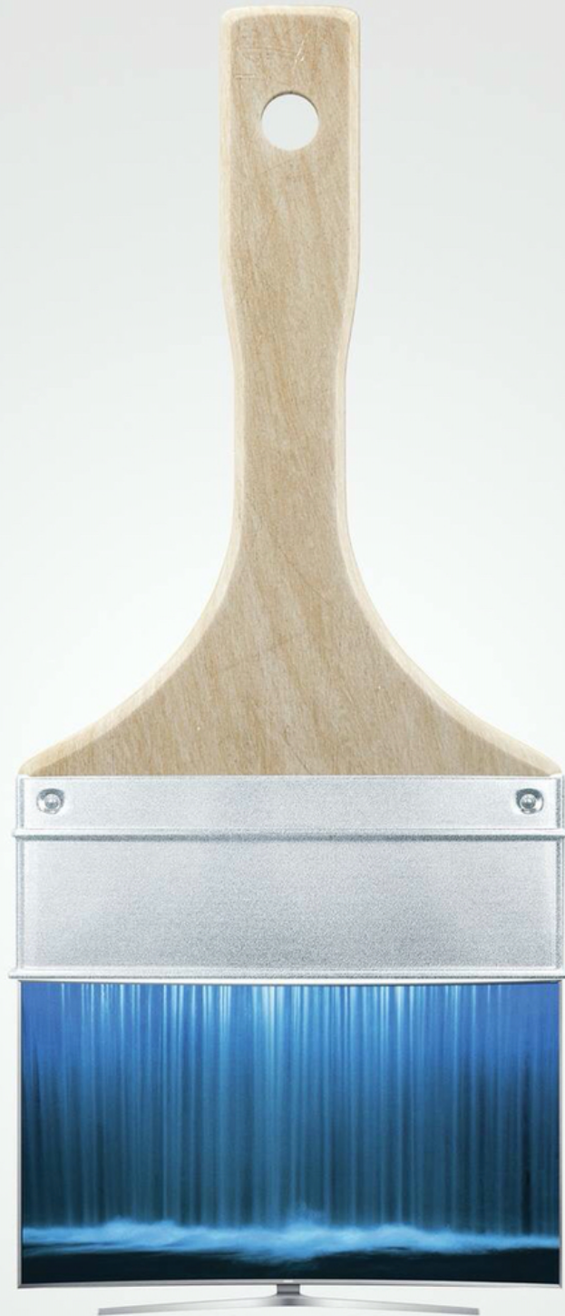
IMAGEN OPCION B