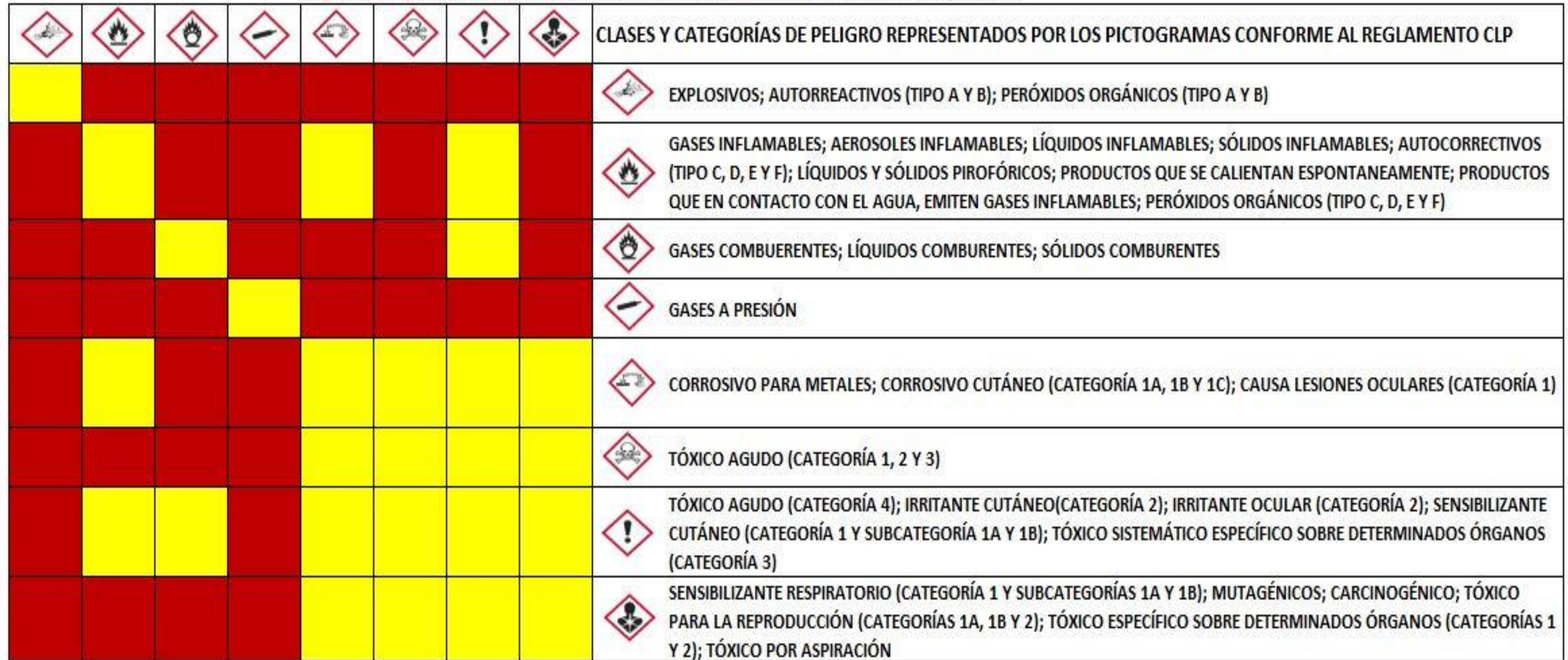
TABLA DE INCOMPATIBILIDADES EN EL ALMACENAMIENTO CONJUNTO DE PRODUCTOS QUÍMICOS