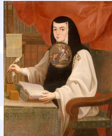
Sor Juana Inés de la Cruz. / Andrés de Islas .

En el mismo escenario, pero tres siglos después, Elena Poniatowska alza la voz en defensa de la libertad y los derechos humanos. Esta periodista, escritora y novelista,