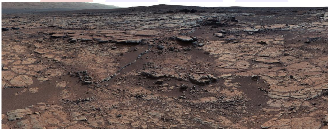
Imagen tomada por Curiosity del Gillespie Lake Member, en el valle Paz de Marte.