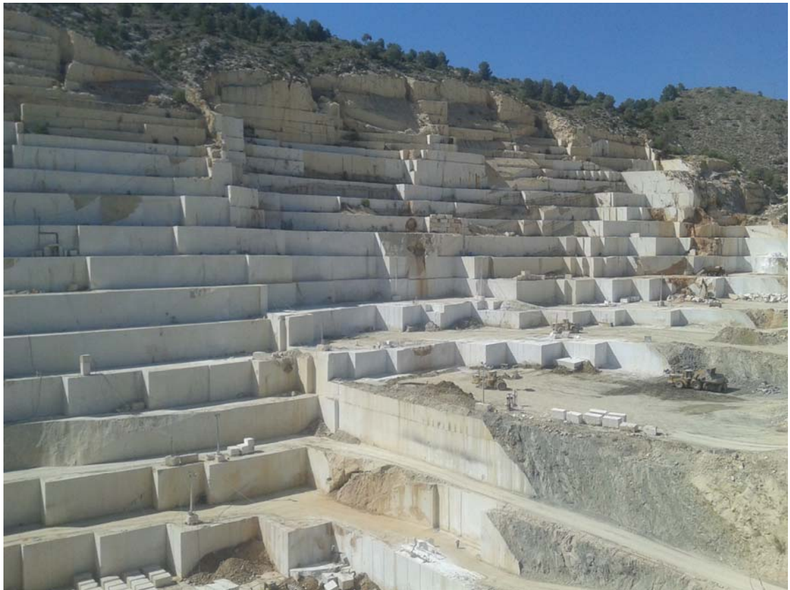
Imagen 2. OPCIÓN B

Explotación de caliza en Cehegín (Murcia)