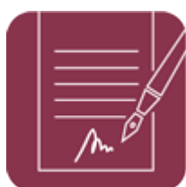
PERFIL DEL CONTRATANTE