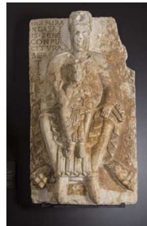
Virgen con el Niño, San Benito de Sahagún M.A.N.