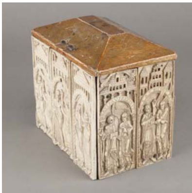
Arqueta de las Bienaventuranzas M.A.N.