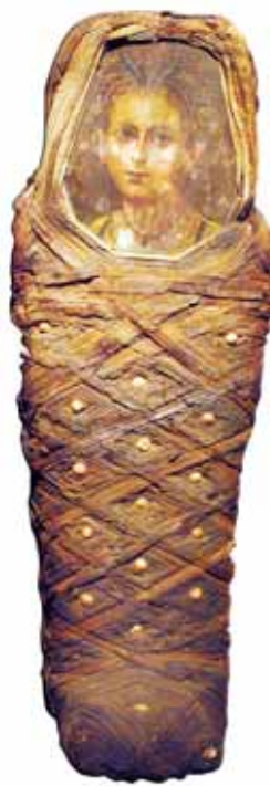
Momia de una niña.

Si el difunto llevaba sudario, se pintaba directamente sobre el lino. Lo curioso es que estas momias, con su retrato pintado encima, no eran enterradas de manera inmediata. Se conservaban durante varias generaciones en unas dependencias donde sus familiares les podían rendir homenaje tras su muerte. Lo más llamativo de estas pinturas son sus ojos. Sus pupilas marcadas se clavan en el espectador, llenando de vida el retrato. Es evidente que representan a personas en concreto, que mantienen su afán de perdurar en vida. Para los egipcios, la desaparición una vez muertos era algo inconcebible, y estos retratos son un nexo de unión con la vi-