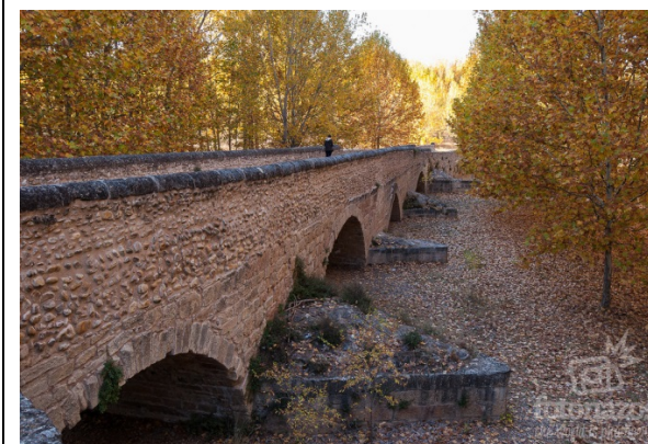
PUENTE ROMANO DE TALAMANCA DE JARAMA

Matemáticas, ciencia y tecnología en la Antigüedad grecolatina