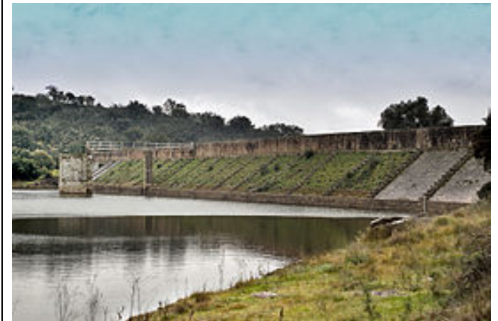
Presa de Cornalvo (Mérida)