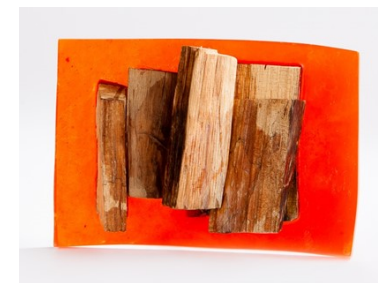
"Escabeche de atún". Madera y resina, 50x35x12 cm.