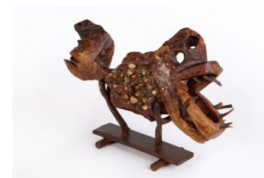
"Pez abisal". Hierro, piedra y madera, 35x27x14 cm