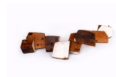
"Pecio I". Madera policromada, 150x67x28 cm.