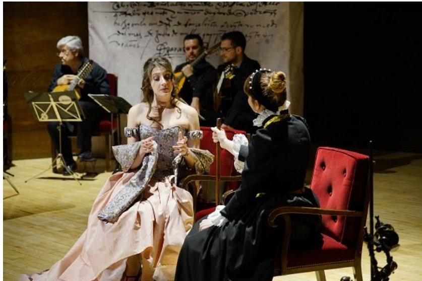
Una de las escenas de la obra con músicos. / Jesús Román Martínez.

UCC-UCM, 3 de julio.- El renacimiento español regresa el próximo 8 de julio al Teatro Bellas Artes de Madrid de la mano de “Pues amas... ¡qué cosa es amor!”, una obra sobre las facetas más desconocidas de una de las figuras más importantes de la poesía española: Garcilaso de la Vega.