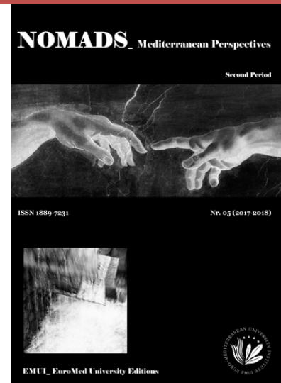
Portada de la revista Nomads .

Desde el año 2009 se edita en paralelo y en formato convencional una revista internacional, Nomads. Mediterranean Perspectives , órgano oficial del EMUI EuroMed University (Salento) , al que pertenece el Instituto Universitario de Investigación EMUI (UCM) . Esta proyección internacional refuerza la presumible 'garantía' de difusión y alcance de un producto de alto impacto científico y tecnológico, como es, en la actualidad, Nómadas .