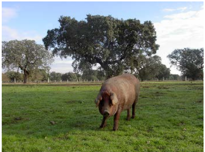
Cerdo ibérico en montanera

El gamma-tocoferol se absorbe y acumula en cantidades directamente relacionadas con el consumo de bellota. Por tanto, se puede establecer una relación entre el contenido de esta sustancia y los kilogramos engordados por el cerdo en montanera. Dicho compuesto aparece en cantidades mínimas en los cerdos alimentados con piensos por lo que la determinación del contenido en gamma tocoferol permite diferenciar aquellos cerdos cebados a base de piensos de aquellos que han sido cebados con bellota exclusivamente e incluso de aquellos que han ingerido una cantidad de bellota y han sido terminados con piensos.