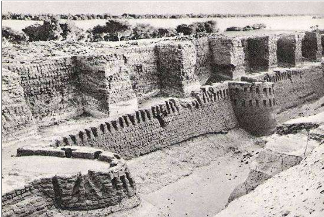
Fig. 1: Fortaleza de Buhen, actualmente sumergida bajo las aguas del Lago Nasser tras la inauguración de la presa de Aswán (Aldred 1978).