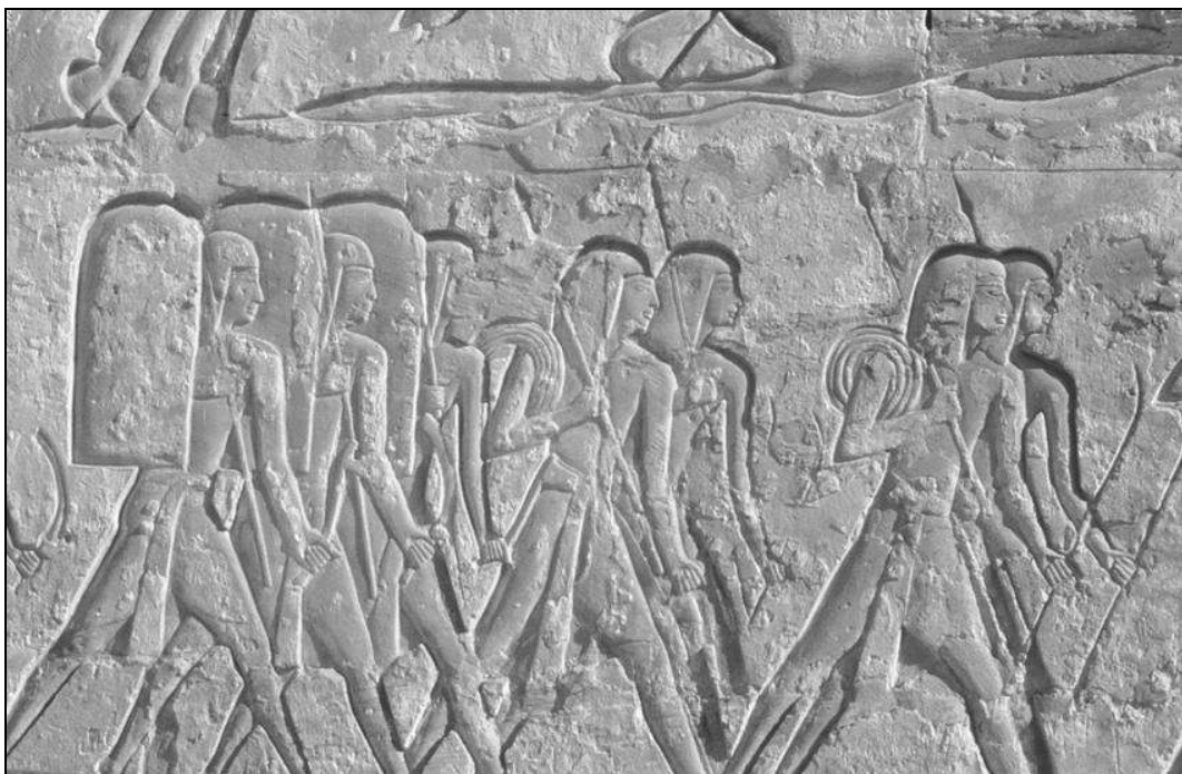
Fig. 2: Soldados de infantería en marcha. Relieves de Medinet Habu (Trello 2000, 18).