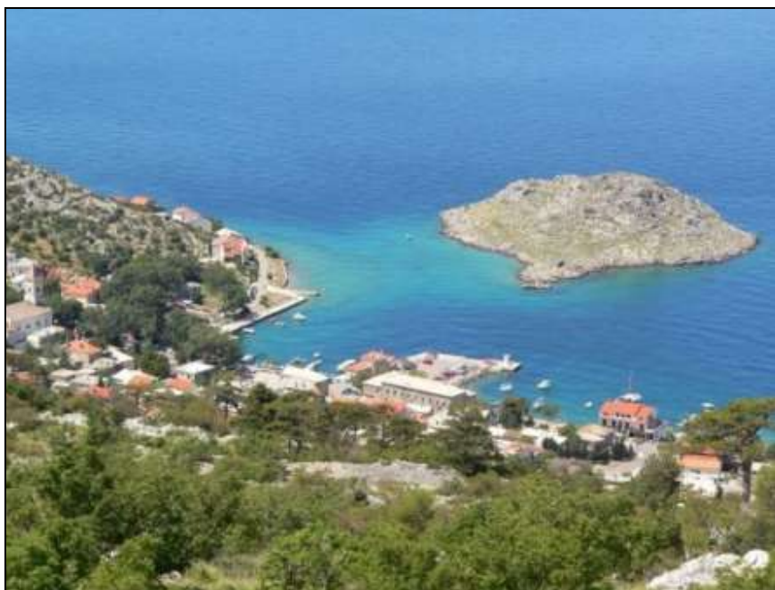
Fig. 3: Il centro di San Giorgio/Sv. Juraj