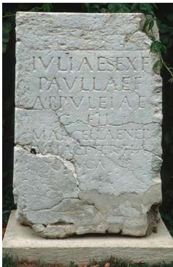
Fig. 4: Iscrizione CIL , III, 3015