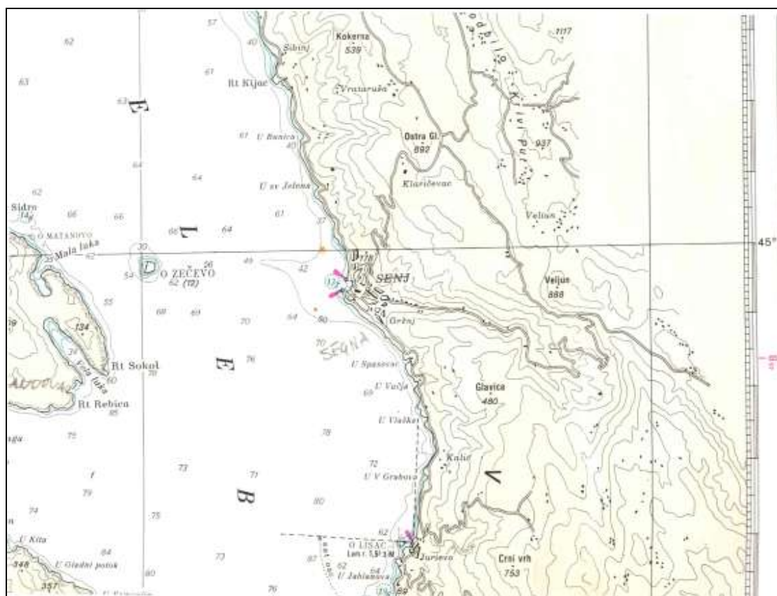
Fig. 2: La costa tra Segna/Senj e San Giorgio/Sv. Juraj nella realtà