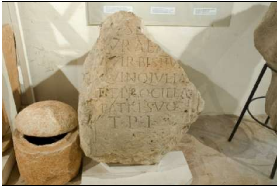
Fig. 5: Iscrizione Zaninović 1975