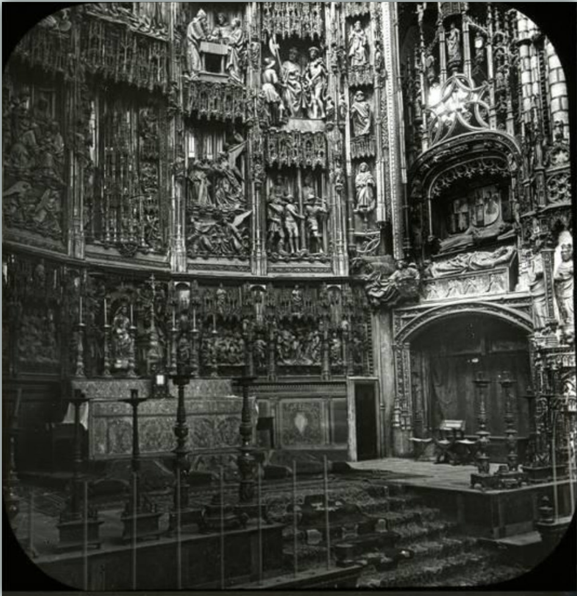
Imagen: Retablo Mayor de la Catedral de Toledo, 1498-1504

USOS Y COSTUMBRES EN LAS CATEDRALES HISPANAS HASTA 1700: HISTORIA, MÚSICA Y ARTE