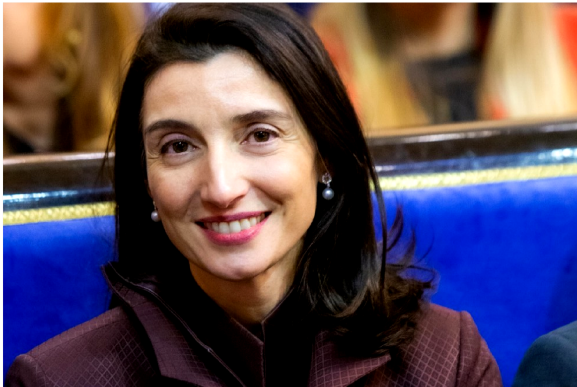
Pilar Llop Cuenca, reconocida jueza y actual presidenta del Senado.

Una opinión con la que no puede estar más de acuerdo Pilar Llop Cuenca, reconocida jueza y actual presidenta del Senado. "Tenemos dos retos enormes que afrontar como país en muy corto espacio de tiempo: el primero es, sin duda, frenar esta tragedia que está causando muerte, angustia y una honda tristeza que nos afectará mucho como individuos y como sociedad. Y el segundo y no menos importante es construir un nuevo modelo social basado en la igualdad de oportunidades, en el fortalecimiento de lo público , en definitiva, en un mundo más justo y equilibrado, que no deje a nadie atrás".