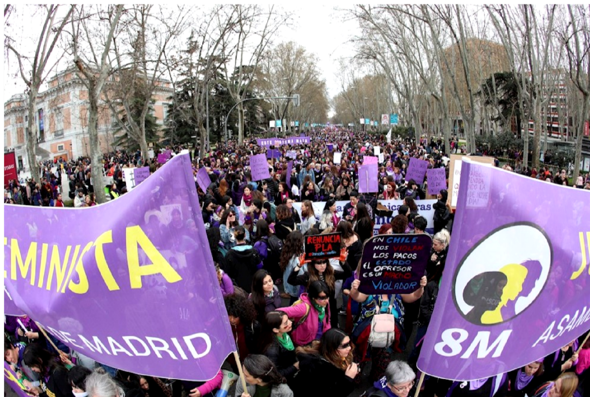
Marcha feminista del 8M en la ciudad de Madrid.

"Los cuidados son un acto de amor, solidaridad y generosidad, no de resignación. Cuidarse no debe implicar renunciar al autocuidado, lo cual ocurre habitualmente. En el confinamiento, corremos el riesgo incrementar el trabajo doméstico y de cuidados , así como la carga mental que esto supone, en detrimento de la disponibilidad de tiempo personal y profesional", explica esta doctoranda.