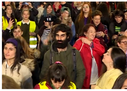
Marcha feminista del 8M en Madrid II.

Por su parte Laura Freixas Revuelta destaca que lo que se ha de cambiar es el orden mundial deshumanizado y machista que nos ha regido hasta ahora. "Creo que las mujeres somos más conscientes de la vulnerabilidad humana y valoramos más que los hombres los cuidados, la vida, las relaciones personales... no por ninguna esencia (aunque sin duda la maternidad contribuye a explicarlo), sino porque históricamente los hombres han desarrollado una personalidad más individualista, competitiva y cerebral, mientras que las mujeres se han -o las han- especializado en lo concreto, cotidiano, emocional y solidario.