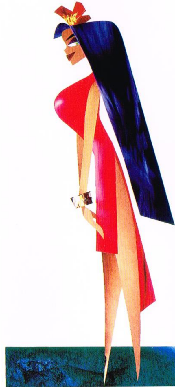
TEDDY NEWTON, 2001 collage, 11 x 17"