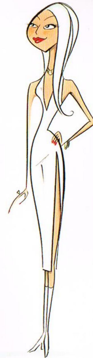
TEDDY NEWTON, 2001 pencil and marker, 6 x 15"