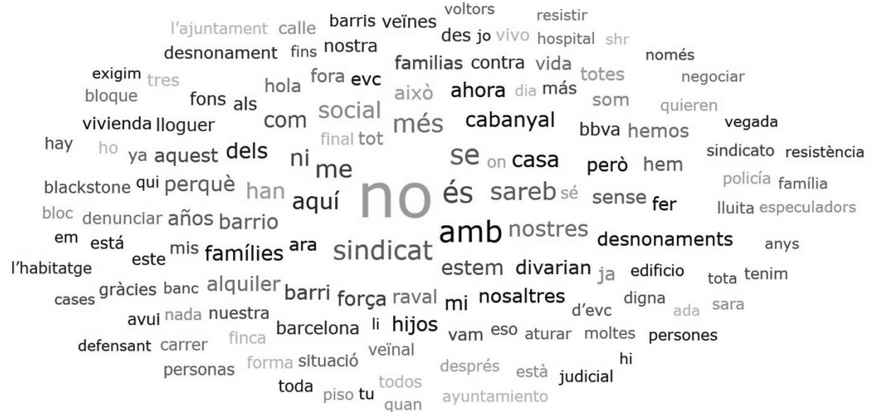
Figura 4 Nube de palabras conjunta

Elaboración propia mediante el software de Atlas.