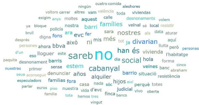
Figura 2 Nube de palabras del SBC

Elaboración propia mediante el software de Atlas.