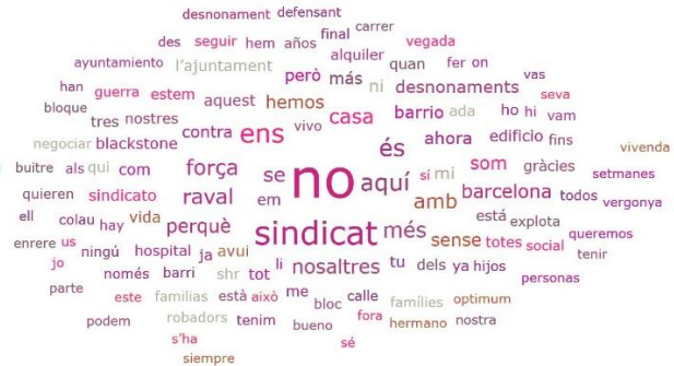
Figura 3 Nube de palabras del SHR

Elaboración propia mediante el software de Atlas.