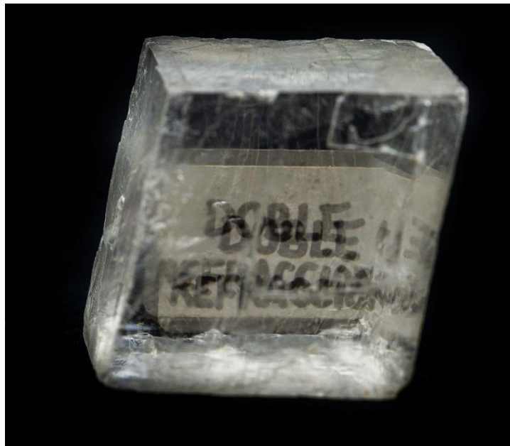
Doble refracción en el espato de Islandia.

La importancia en Mineralogía de esta variedad de calcita no se restringe a la deducción hecha por Haüy sobre las “moléculas integrantes” en relación con la estructura interna de los minerales. En el espato de Islandia, el científico danés Erasmus Bartholinus observó en 1669 que, cuando la luz lo atraviesa, cualquier imagen situada tras él se descompone en dos imágenes diferentes: una situada exactamente en la posición inicial y otra desplazada con respecto a ella.