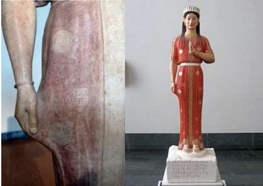
Fig. 3 Detalle del quitón. Reconstrucción de la kore . Las imágenes de la estatua proceden del repositorio Wikimedia Commons .