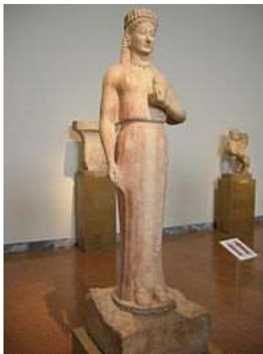
Fig. 2. Imagen de la kore . Museo Nacional de Arqueología de Atenas.