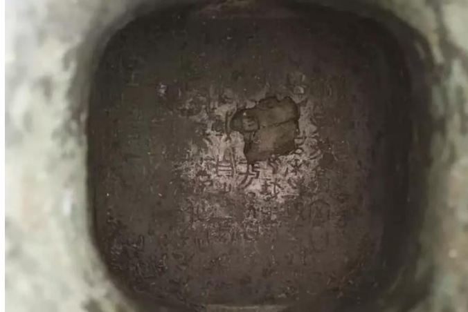
Fig. 2. Inscripción en el fondo del zhuwen . Disponible en: https://m.91ddcc.com/t/183491 [Consulta: 25 de junio de 2019].