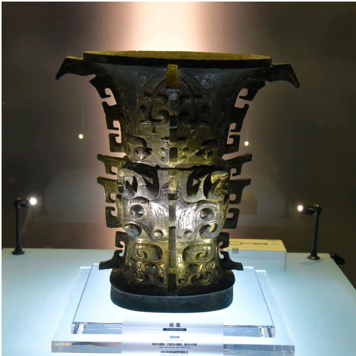
Fig. 1. He Zun. Fuente: Museo de Objetos de Bronce de la Ciudad de Baoji, China. Disponible en: https://img1.qunarzz.com/travel/d9/1711/95/f7922687379d6ab5.jpg [Consulta: 25 de junio de 2019].