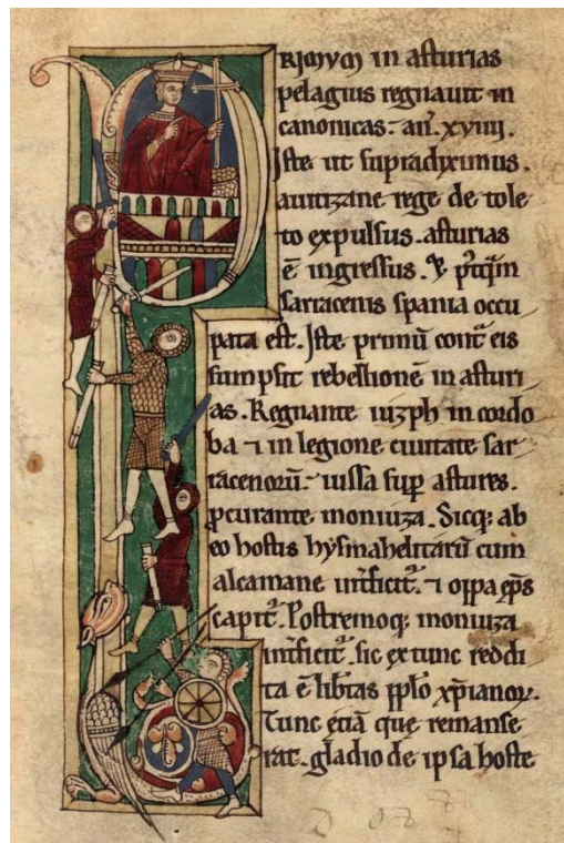
Fig. 3. Folio 23r. del manuscrito 2805 de la Biblioteca Nacional de España.

recogen este suceso, como las escritas en tiempo de Alfonso III, sí que muestra el milagro mariano que se produce en la cueva junto con las diversas reliquias traídas de Toledo - como un Lignum Crucis y la casulla de san Idelfonso. Esto es de extrañar, puesto que si ya se conociera este relato acerca de la aparición milagrosa a don Pelayo también esto debería de haber sido transmitido a través de las fuentes literarias del momento y sin embargo no hay rastro de ello. Cid Priego expone que fue el escritor Juan de Portilla, perteneciente ya al siglo XVII, quien argumentó que la ausencia en los escritos de tal milagro se produjo puesto que los judíos y herejes fueron los encargados de hacerlo desaparecer (Cid Priego, 1991b: 64). Sin embargo, el propio autor resta importancia a dichos argumentos que no tienen un fundamento sólido.