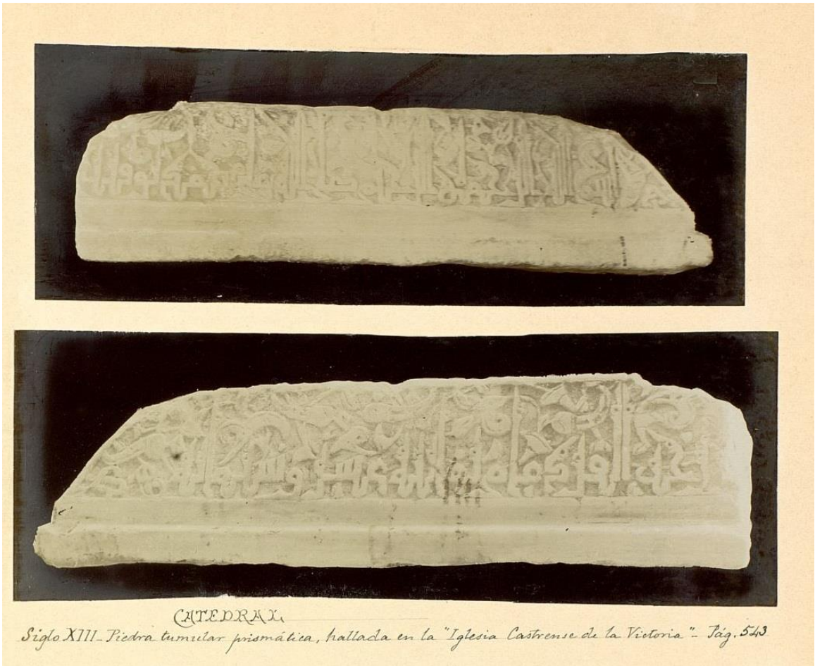
Fig. 2. Fragmento A de la mqabriyya malagueña. Amador de los Ríos, inédito: lám. 20. Catálogo monumental de España. Málaga . Disponible en: https://goo.gl/RGuaJP [Consulta: 30 de octubre de 2018].