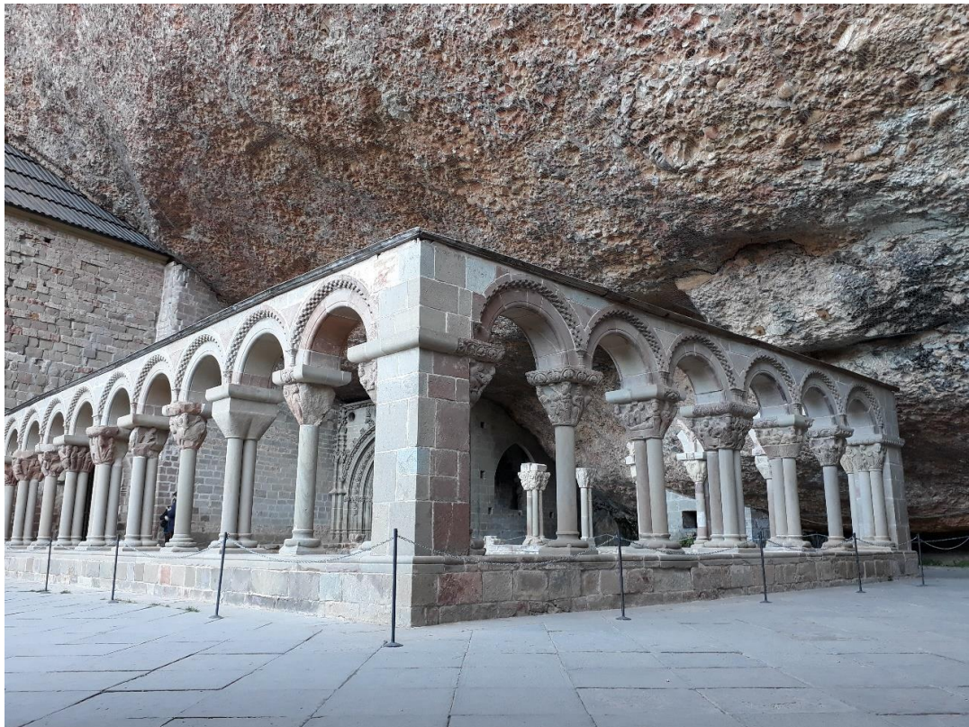
Fig. 2. Claustro románico de San Juan de la Peña.