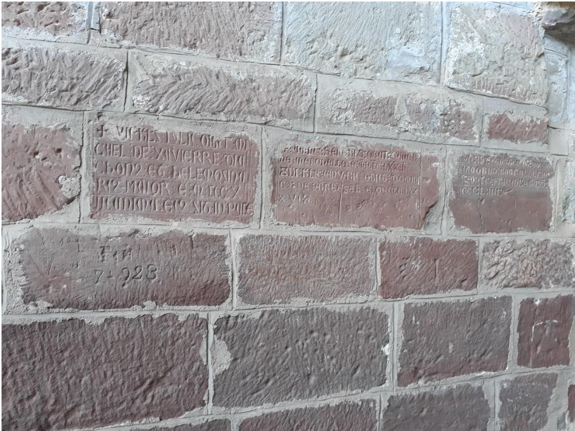
Fig. 3. Inscripciones seguidas de características similares entre sí en el claustro de San Juan de la Peña.