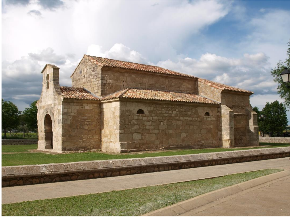
Fig. 3. Iglesia de San Juan de Baños, Palencia.