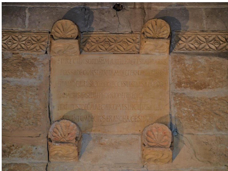
Fig. 1. Inscripción de la iglesia de San Juan de Baños