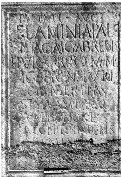
Fig. 2. Campo epigráfico del pedestal de Igabrum .