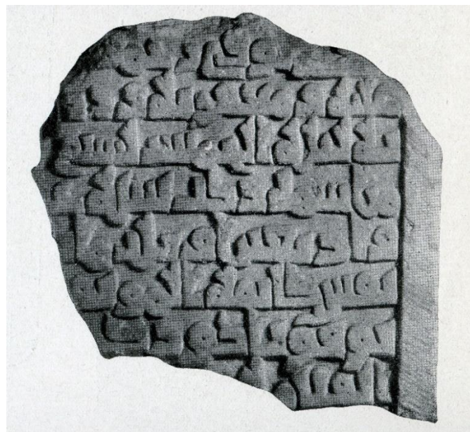
Fig. 2. Cara B de la lápida D267. Ocaña 1964: lám IIC