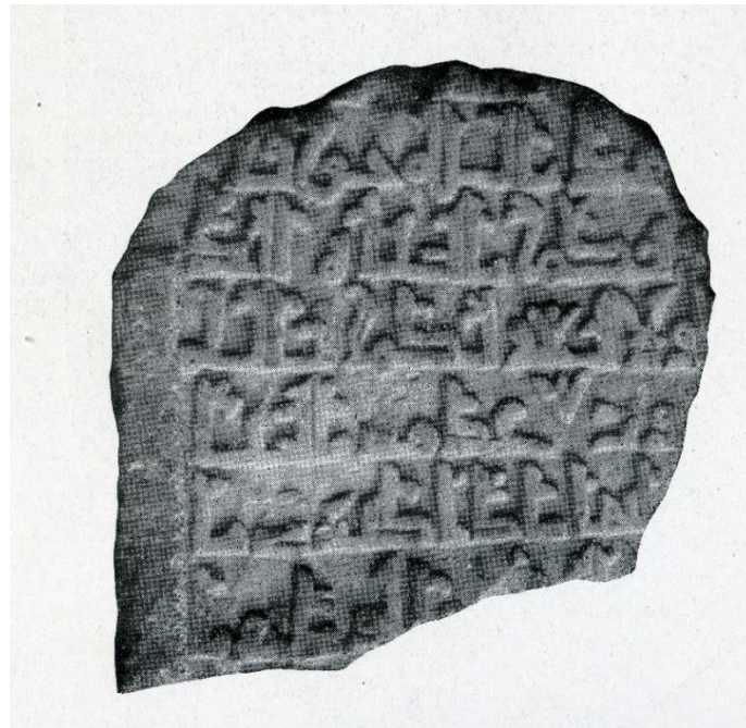
Fig. 1. Cara A de la lápida D267. Ocaña 1964: lám. IIb

Torres Balbás, Leopoldo (1957). “Cementerios hispanomusulmanes”. Al-Andalus: Revista de las Escuelas de Estudios Árabes de Madrid y Granada , XXII, p. 178.