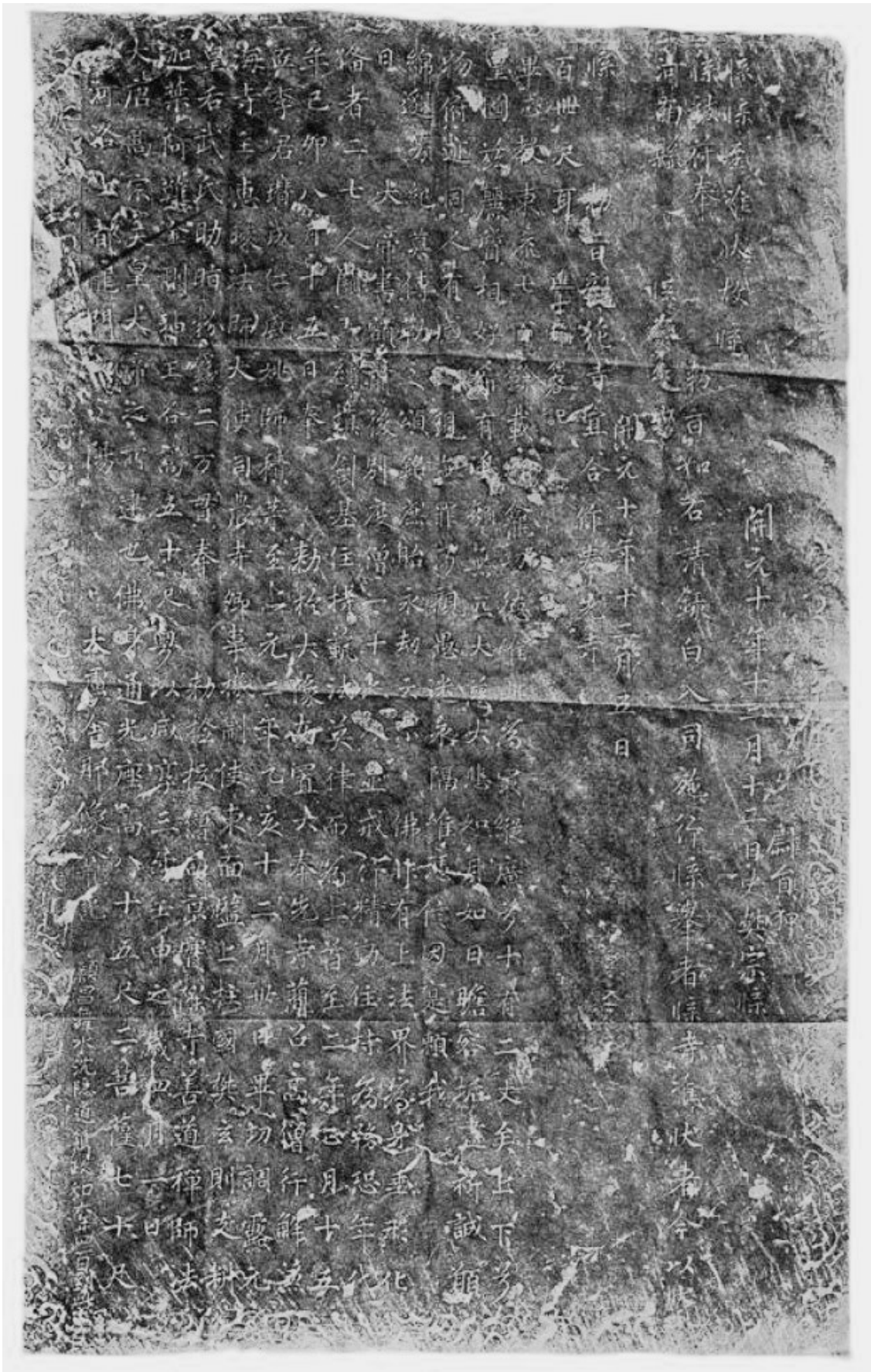
Inscripción del gran santuario de la imagen del Vairocana. Calco tomado de Chavannes 1909: fig. 633, pl. CCCXXXVIII