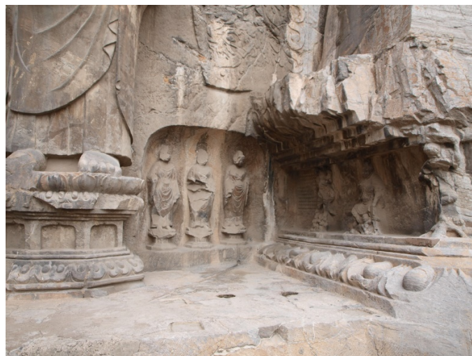
Estado actual del lado sur del trono del gran Buda (Luoyang, China), Templo Fengxian de Longmen.