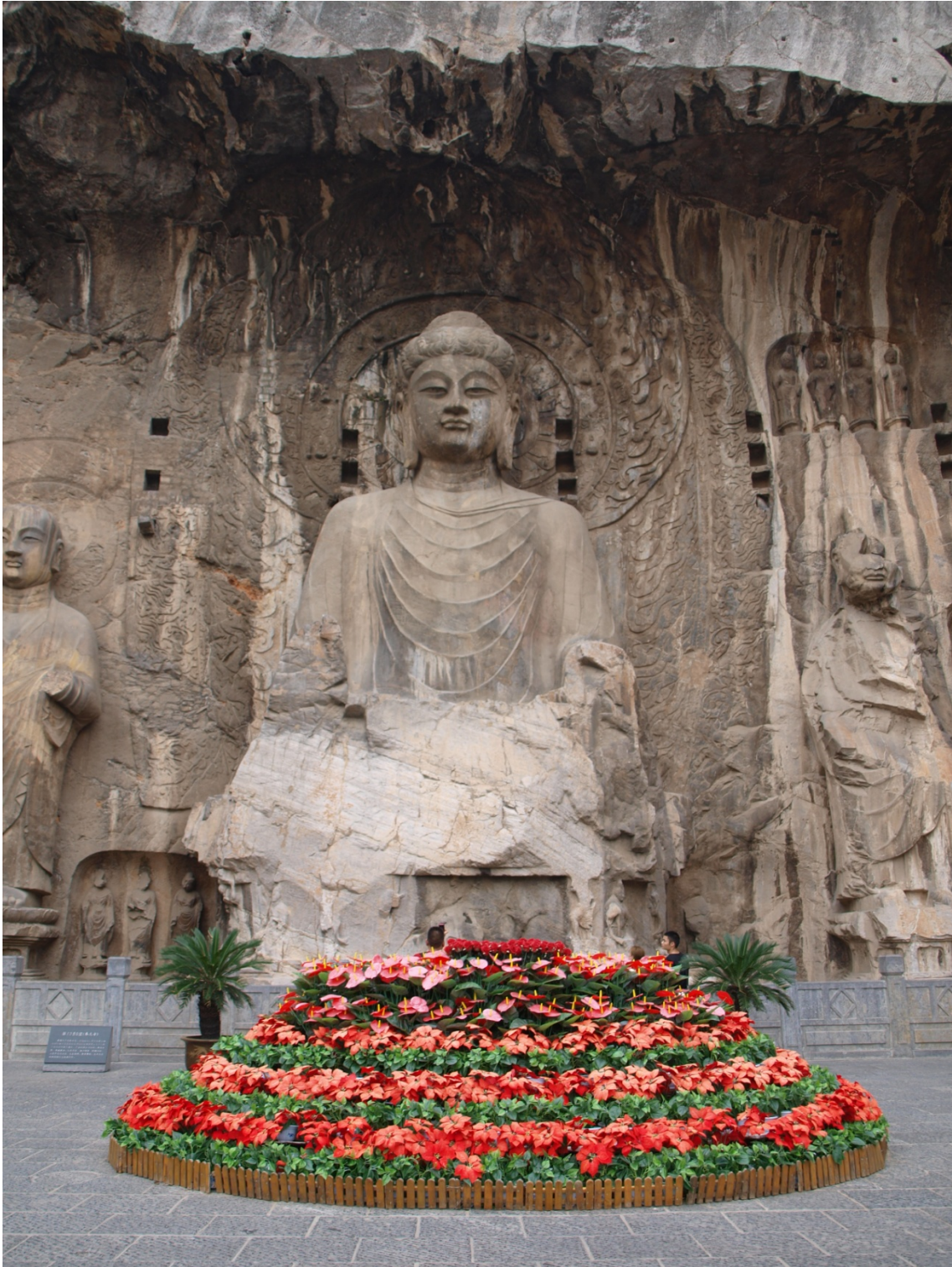
Estado actual del gran Buda Vairocana (Luoyang, China), Templo Fengxian de Longmen.