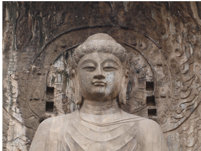
Detalle de la cara del gran Buda (Luoyang, China), Templo Fengxian de Longmen.