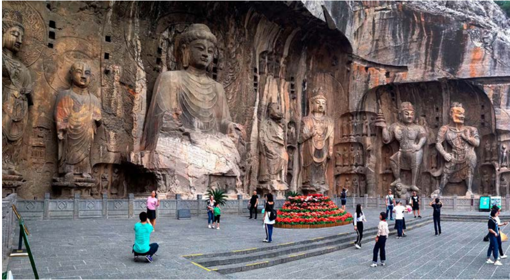
Estado actual del templo Fengxian desde el lado sur (Luoyang, China), Templo Fengxian de Longmen.