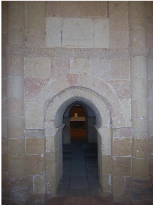
Situación de la inscripción.