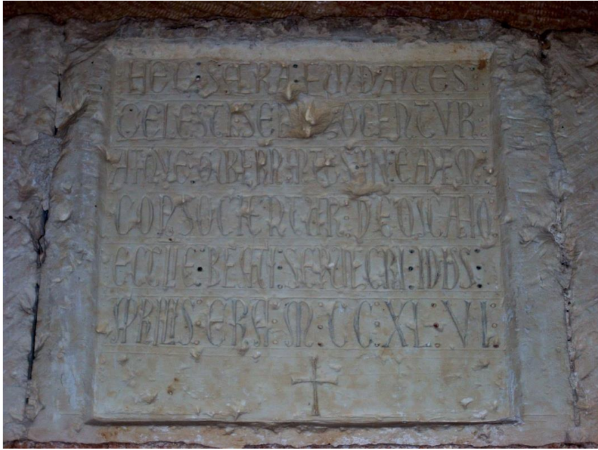
Inscripción fundacional de la Iglesia de Vera Cruz.